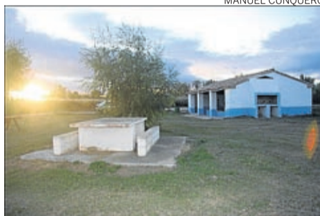
El lavadero se ha rehabilitado.

ción de placas solares en edificios municipales como la tienda o el centro social, mientras que desde hace años el alumbrado público es todo de tipo led. «Este es un programa en el que año tras año hemos invertido para lograr bajar los consumos energéticos, dis-