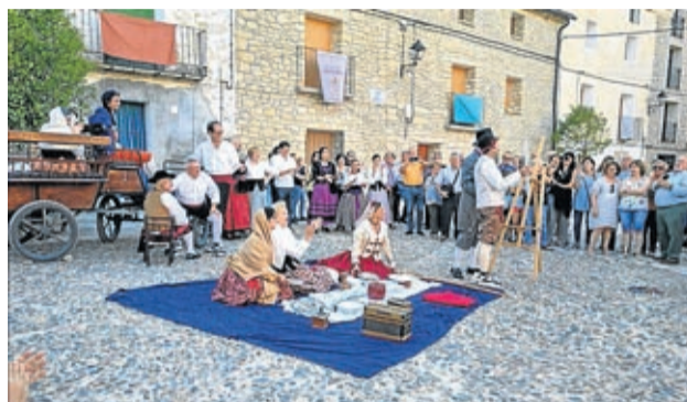
Por las calles se recrearon escenas de 'La vida de Goya'.

La localidad se transformó y regreso a la época en la que vivió el pintor