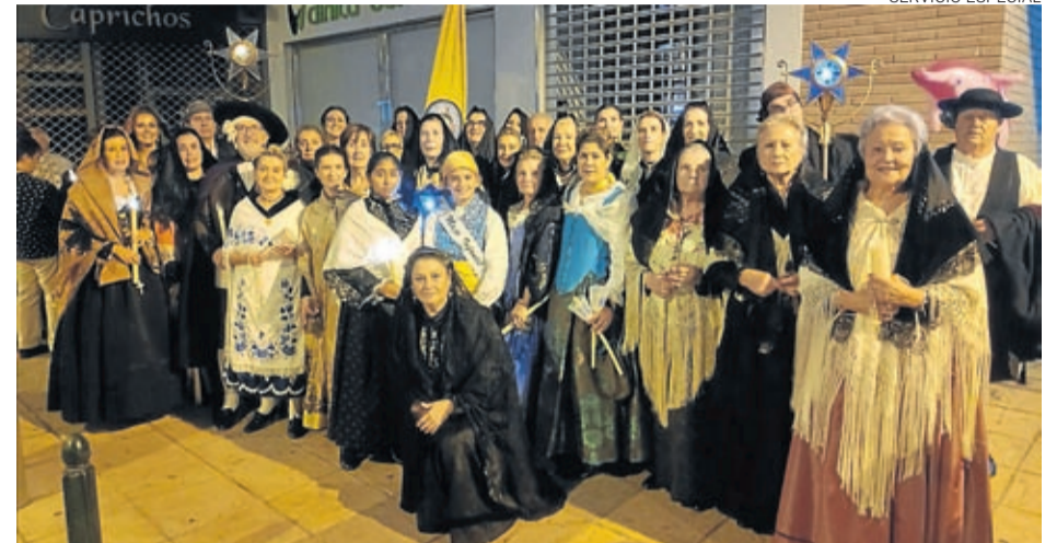
Los vecinos de Lécera vistieron sus mejores galas regionales en el Rosario de Cristal.

La comisión de Cultura del Ayuntamiento de Lécera ha conseguido que, por primera vez en más de cien años que se lleva celebrando el Rosario de Cristal en Zaragoza, el pueblo lecerano haya podido acompañar a su patrón Sto. Domingo de Guzmán, dominico que popularizó el rezo del Rosario por el mundo, en una de las ex-