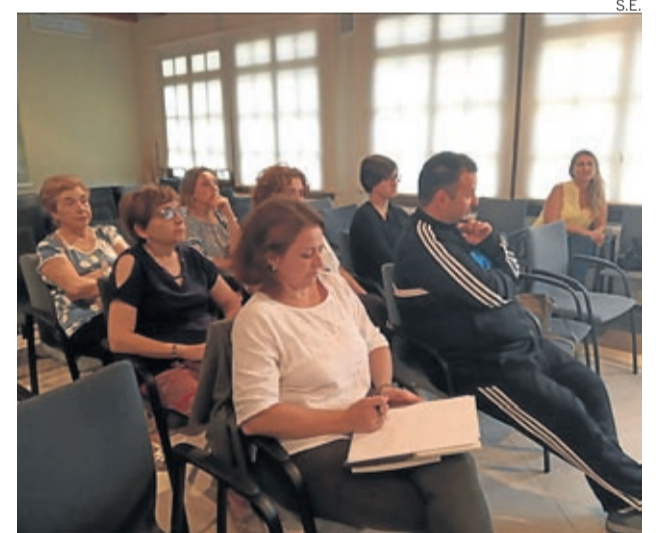
El taller se impartió en la sede comarcal.

alternativa a la judicial, los participantes han valorado los aspectos objeto de mediación en nuestro entorno, y los recursos que actualmente tenemos en mediación, concluyendo que son precisas campañas específicas de divulgación, así como asesoramiento profesional en este campo, y facilitar el acceso a la mediación como un servicio adicional. ■