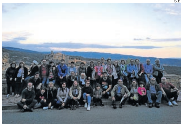
La AC La Cuba organizó un viaje al Somontano.