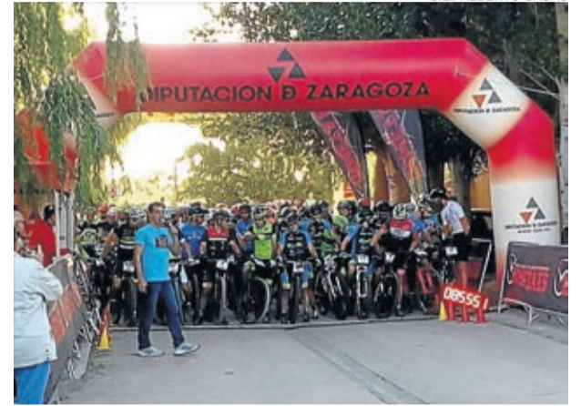
Salida de la décima edición de la Azuara Bikemaraton.