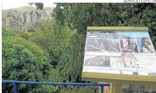
Se han colocado paneles en las rutas de escalada.