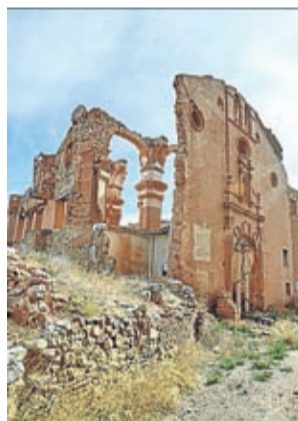
Estado actual del convento.