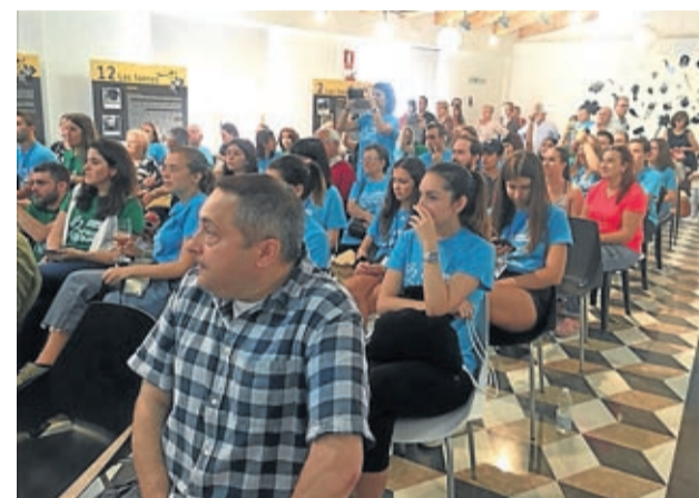
El encuentro contó con una gran asistencia.

escritores y una directora de cortos de 15 años llenaron de color este espacio. La muestra permitió conocer su talento y creatividad a través de las obras expuestas.