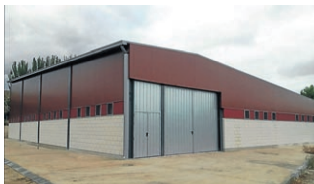
El consistorio acaba de recibir las obras del pabellón.

Tras la visita, los miembros de la junta directiva de Adecobel y el equipo técnico se reunieron para analizar las modificaciones presupuestarias y establecieron los cambios que consideraron oportunos para una ejecución lo más eficaz posible de los fondos, además de dar a conocer algunas de las acciones ejecutadas desde la última reunión. ■