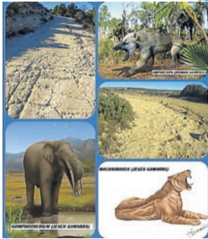
Así eran los animales de la época.

Otras icnitas muy apreciables en el yacimiento son las dejadas por félidos: tigres dientes de sable, muy habituales en la época, eficientes cazadores que poseían unos caninos superiores muy alargados. Dos géneros que posiblemente habitaron en esa época La Puebla de Albortón serían Sansanosmillus y el enorme Machairodus , del tamaño de un león. También encontramos aquí rastros y huellas fósiles que podríamos atribuir a suidos, rumiantes,