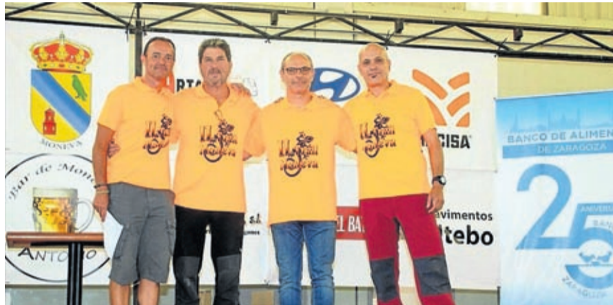
Representantes de la organización de la prueba.