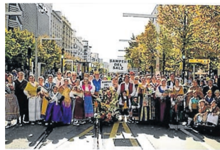
Samper del Salz.