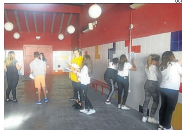
Los jóvenes reporteros planifican el nuevo curso.