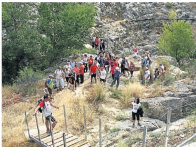
Los vecinos de Lagata realizaron una andada a Almonacid.