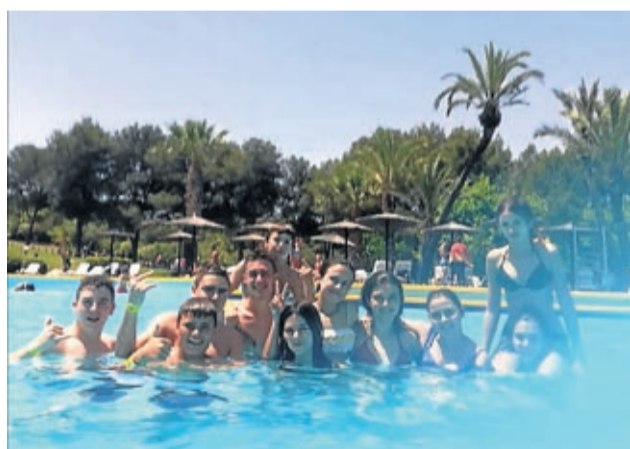
La OCIJ organizó una salida al Aquapark.

Si en cualquier momento alguien necesita, o sencillamente le apetece, obtener un título, prepararse para un prueba, formarse, pasar un rato distraído... sólo tiene que pasarse por el Aula de Educación de Personas Adultas en su localidad o en la Sede de la Comarca e informarse. ¡Seguro que encontramos algún curso o actividad que responda a sus expectativas! ■