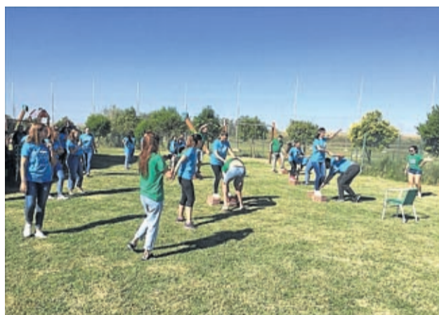
Durante el día también hubo momento para la diversión.