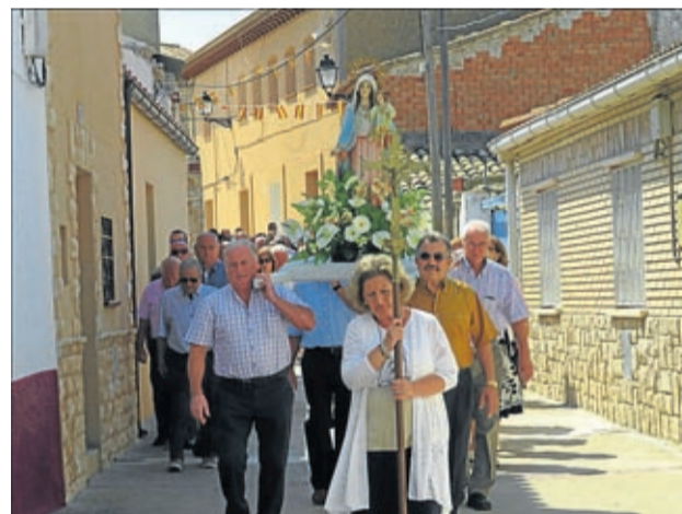
En La Puebla de Albortón sacaron en procesión a la Virgen.

LA CRÓNICA cronicas@aragon.elperiodico.com