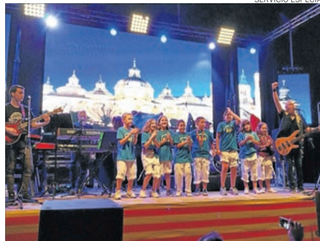
Los pequeños de Plenas también se divertieron.