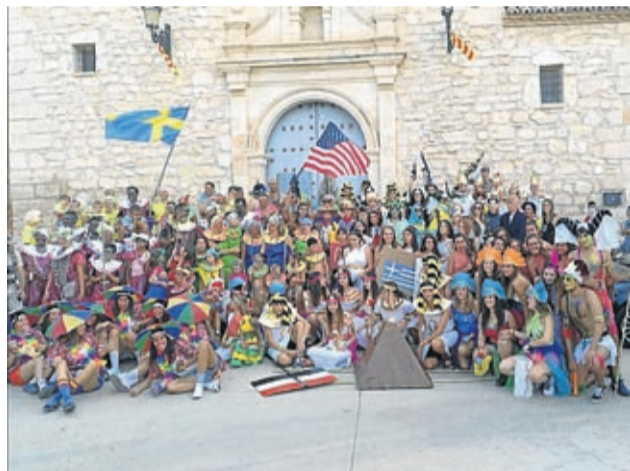
La cabalgata de disfraces del mundo de Letux fue un éxito.

Conciertos, disfraces, andadas y comidas populares, entre otros, han animado la agenda