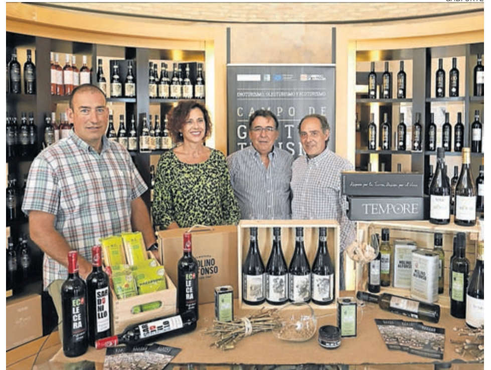
Los responsables de las empresas promotoras de GastroBelchite junto al presidente comarcal.

«Ha sido un año muy satisfactorio y hemos logrado la mayoría de los objetivos que nos habíamos propuesto. El primero era poner en valor el territorio y dar nombre a Gastroturismo Campo de Belchite y a las tres empresas. Es decir, explicar lo que hacemos, dónde estamos y lo que