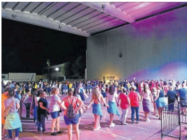
Las fiestas de Plenas congregaron a numerosos vecinos.