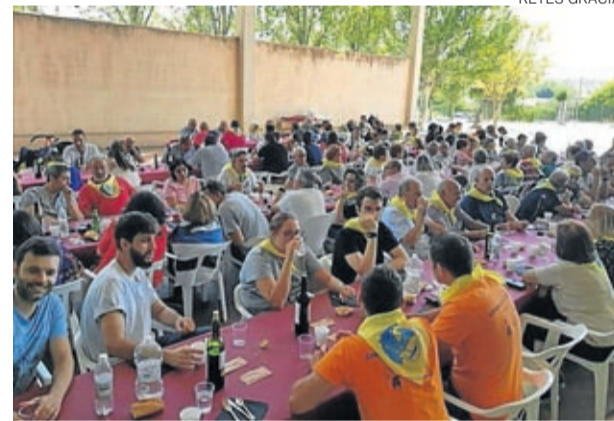
La mañana acabó con una comida popular.

Un homenaje a base de música, flores, palabras y poesía que hizo aflorar los sentimientos a ras de piel y que acabó con unos fuegos artificiales. ■