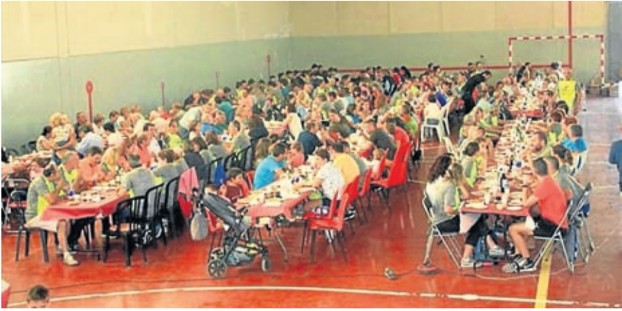
La jornada acabó con una multitudinaria comida.