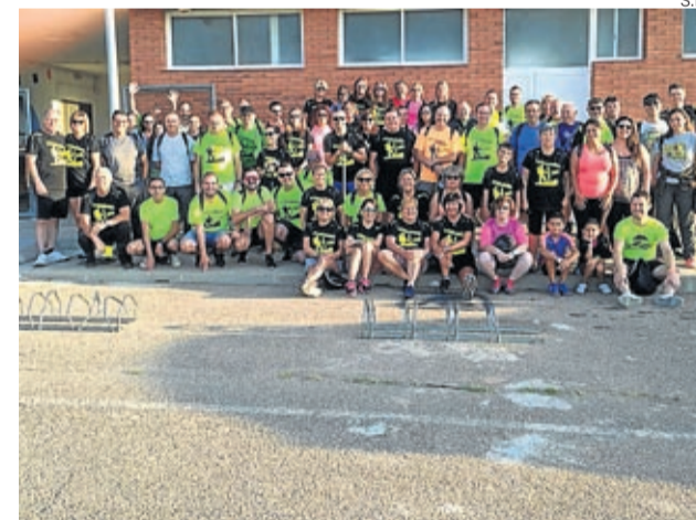
Unos 80 andarines se animaron a realizar el recorrido.

Coincidiendo con el inicio de las fiestas de Letux, unos 80 andarines realizaron el 29 agosto la Andada de Fiestas San Ramón que este año consistió en un paseo agradable por la huerta de Letux visitando y recordando algunas de sus antiguas fuentes: Ventura, Miñona, Viñaza, La Caña, Ojos del Prado, Candala y El Lugar. Varias de ellas habían sido limpiadas de hierbas y broza previamente. Al finalizar, todos los participantes recibieron un pequeño obsequio y repusieron fuerzas con un picoteo donde no faltó el afamado queso de Letux. ■