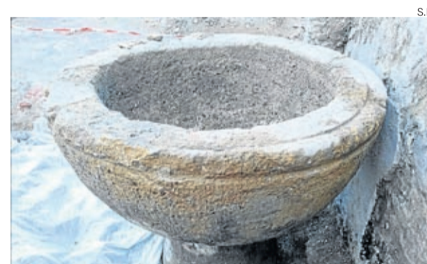
La pila se ha hallado en las excavaciones en la antigua parroquia.

adjudicados, supondrán una inversión de 32.000 euros procedentes del Plan PLUS de la Diputación Provincial de Zaragoza. ■