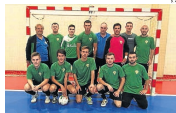
Uno de los equipos de la AD Belchite FS.