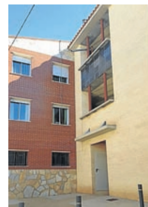
Las obras ya han comenzado.

Para ello, en este año han comenzado los trabajos centrados en el recubrimiento de las paredes (que estaban en basto), la instalación de las ventanas y la división de estancias mediante tabiques, y antes de acabar el año se quiere realizar la instalación eléctrica. Unas obras en las que el ayunta-