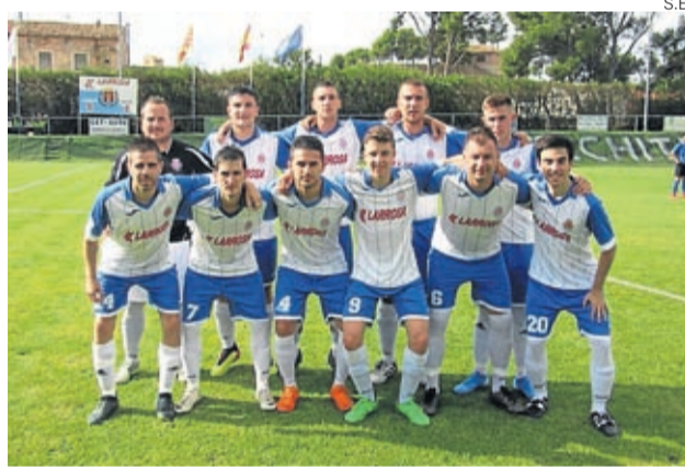
El CD Belchite 97 B en su encuentro contra Épila B.

Por otra parte el equipo filial del CD Belchite 97 también se encuentra en plena competición y está encuadrado en la categoría de 2ª Regional en el grupo 3-1.