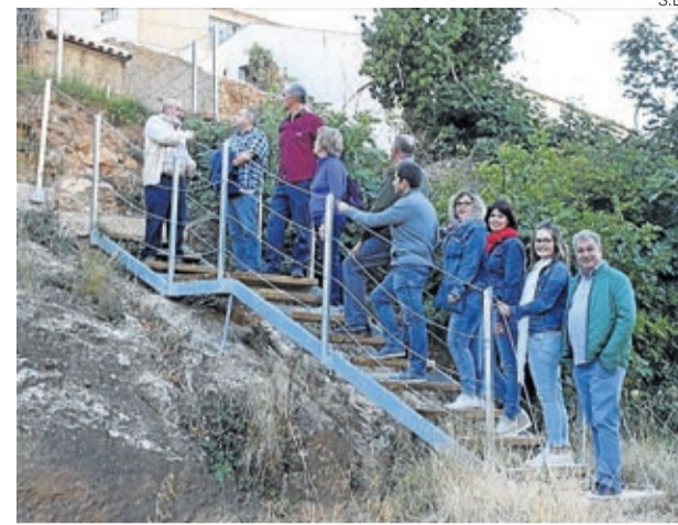
La junta de Adecobel visitó las pasarelas de la presa.

El día 31 de agosto, dentro de las actividades enmarcadas en la Feria del Galgo de La Puebla de Albortón, se realizó una andada hasta las icnitas del mioceno recientemente descubiertas. ■