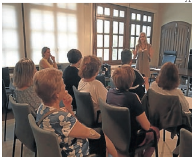
Participantes en el taller de mediación.

Personal de la comarca y de distintas asociaciones participó en un taller dentro del proyecto 'Mediación en el ámbito rural de Aragón', celebrado en la sede comarcal y en el que se abordó esta vía para la solución de conflictos.