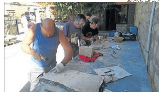
También hubo talleres como el de piedra caracoleña.

Lugar destacado en estas dos jornadas ocupó la Asociación Goyescos que representó el baile de la cinta y cuyos miembros, vestidos de época, se encargaron de ambientar las calles y plazas de la locali-