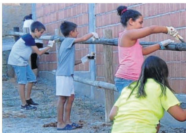
En Letux adecentaron las vallas cerca del río.