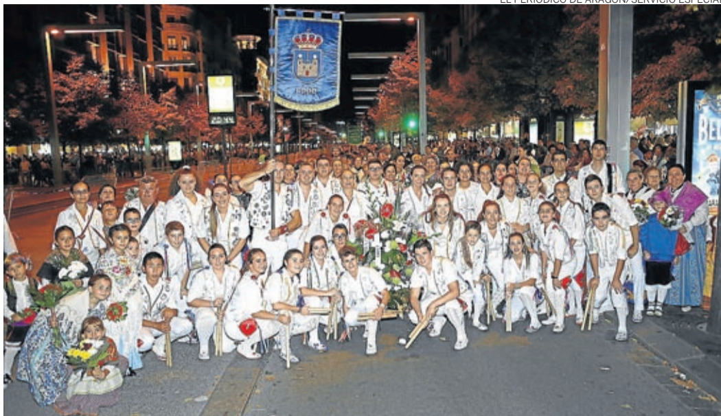
Dance de San Bernardo de Codo.