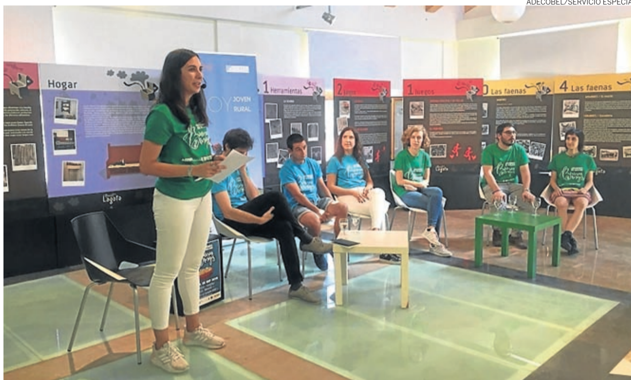
La programación de la jornada incluyó varias mesas redondas protagonizadas por jóvenes.

Además de las mesas redondas, Buenas Migas contó con la Exposición Talento Joven, en la que diez jóvenes de la comarca expusieron las obras artísticas que ellos realizan. Fotógrafos, pintores, ilustradores,