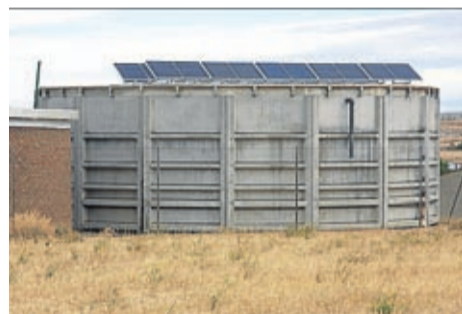
El pozo se alimenta de energía solar.

Esta actuación se suma a la que ya se realizó hace un tiempo en el pozo de La Huerta, por lo que toda la elevación de aguas se lleva a cabo con energías limpias y que reducen el consumo y el gasto corriente de la localidad. Con ello el ayuntamiento sigue en la línea iniciada con la coloca-