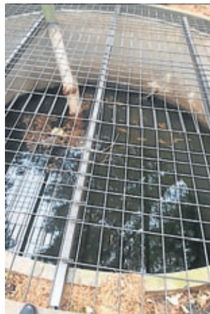
El pozo, cubierto con una malla.

dando el resto para más adelante y, con la ayuda de las máquinas de la Diputación Provincial de Zaragoza se han limpiado las tuberías de desagües de cara a que puedan disponer de su máxima capacidad de evacuación.