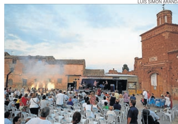
Momento del homenaje a los supervivientes.

Así mismo, el consistorio ha cubierto por motivos de seguridad con una malla el pozo de decantación que se ubica junto a la depuradora más antigua para evitar caídas y también ha arreglado las fisuras detectadas en las vigas y pilares que sujetan del depósito de agua. ■