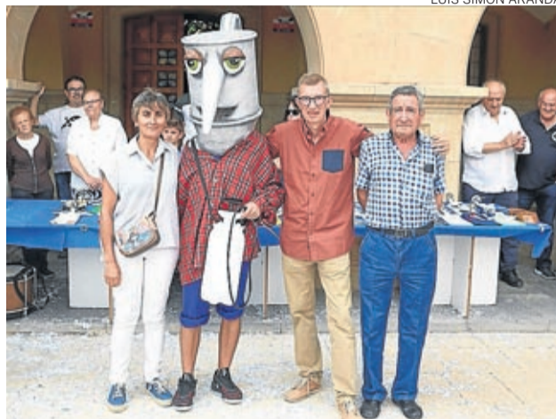
Oleico se presentó junto a sus creadores.

Ahora Oleico está siempre presente en la Oficina de Turismo de Belchite, y viajará a todos aquellos actos que se realicen para promocionar la localidad o sus productos. Además, el ayuntamiento entregó a cada una de las asociaciones locales una réplica de Oleico como títere de mano