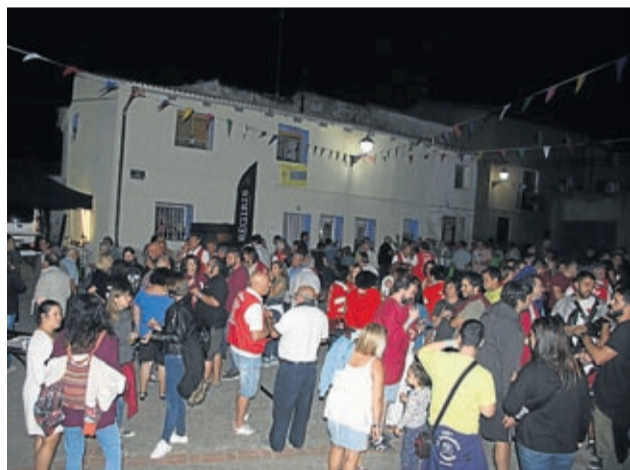
La sidra y las tapas abrieron las fiestas en Lagata.