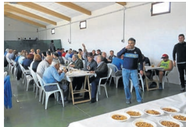
Muchos se animaron a participar también en la comida.