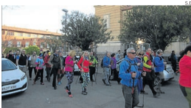
Los andarines partieron del centro de la localidad.

rrido marcado en el mapa en el menor tiempo posible y pasando por todos los puntos señalizados. ■