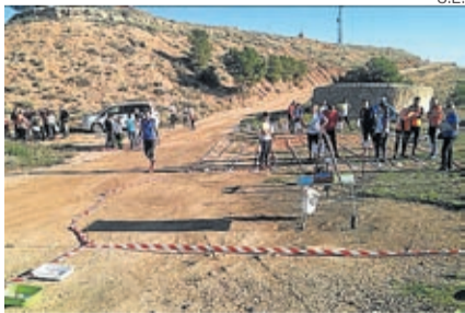
Uno de los puntos señalizados en la prueba.

La prueba, puntuable también para la liga escolar, consistió en completar un reco-