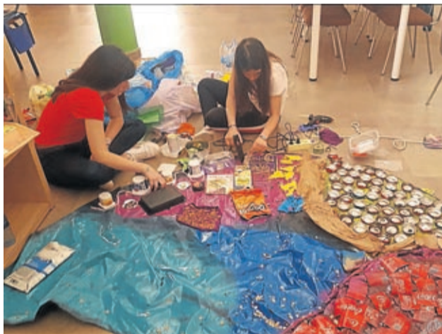
Todas las piezas formarán un gran mural.