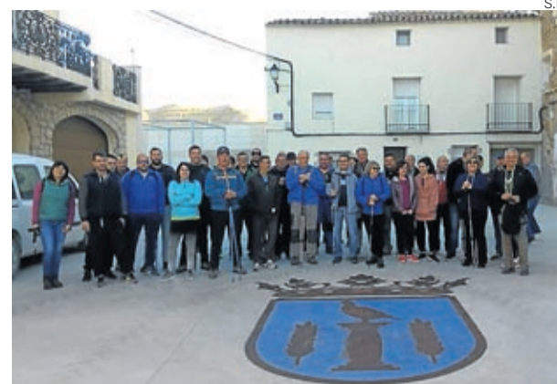
La salida se realizó desde La Puebla de Albortón.