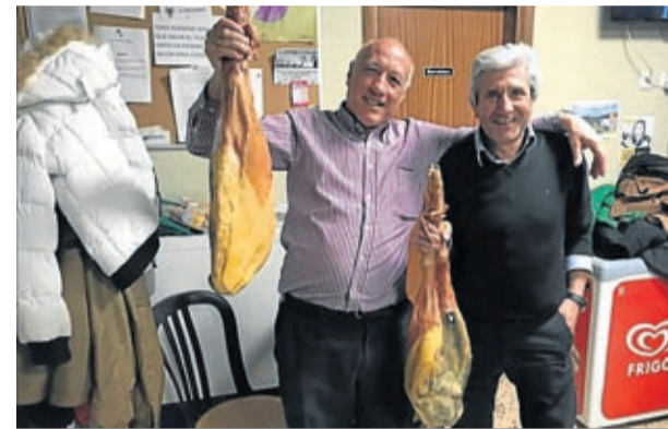
Los ganadores del guiñote se llevaron un jamón.