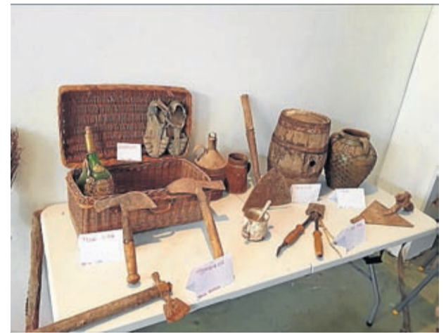
Los vecinos participaron en la muestra de aperos de viticultura.