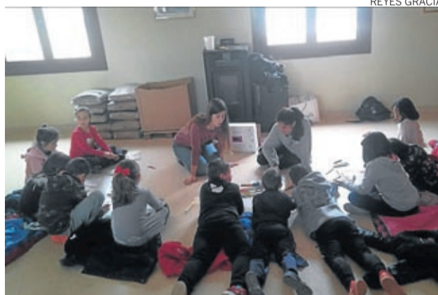
Los pequeños trabajaron sobre la violencia de género.