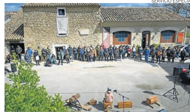
Los versos tomaron las calles y plazas de Fuendetodos.

Y el fin de fiesta fue una mezcla de música con vino español (cortesía de la Denominación de Origen de Cariñena) para todos los asistentes. ■