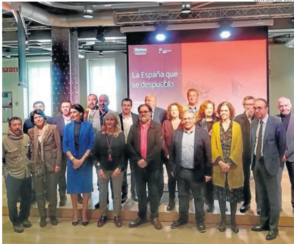
Territorio Goya se presentó a principios de abril en una jornada en Madrid.

La asociación reúne, en estos momentos, a profesionales aragoneses pero también de otras comunidades, quienes,