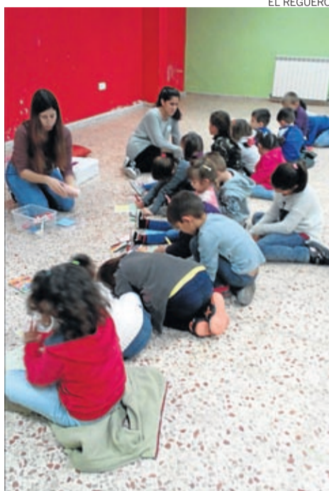
También participaron en un cuentacuentos.