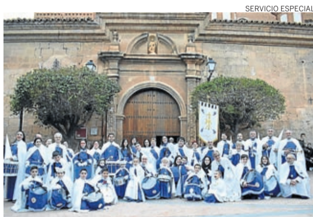
Este año se han incorporado a la cofradía varios jóvenes.

La siguiente salida se realizó ya el Jueves Santo, después de la misa de las 18.30 horas. Mirando al cielo durante toda la