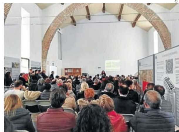
El Convento de San Juan se llenó de vecinos.

El coleccionista dio a conocer la iniciativa ante numerosos vecinos y curiosos