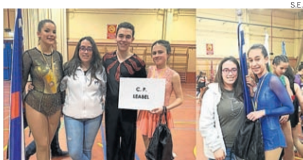
Participantes en el trofeo promesas en Montañaña.