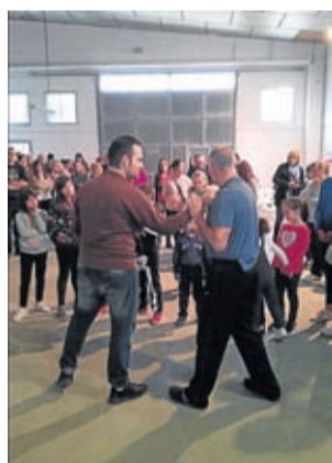
Curso de defensa.

Mayores y pequeños de Plenas han tenido ocasión de participar recientemente en varias acciones enmarcadas dentro de la Campaña contra la Violencia de Género. De esta forma, los niños disfrutaron de un cuentacuentos subvencionado por la DPZ, mientras que se realizó un taller de defensa personal abierto a todos los públicos organizado por el Ayuntamiento de Plenas con