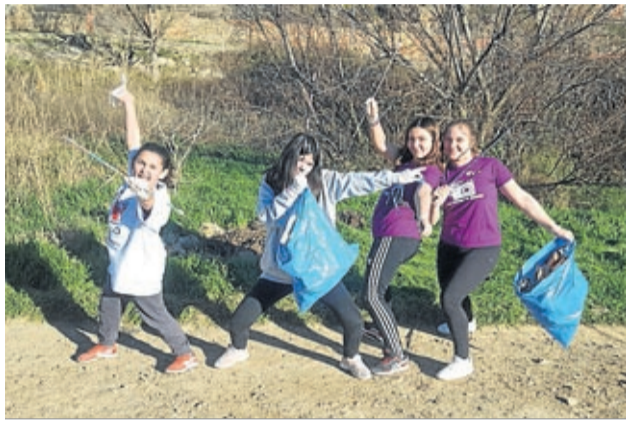
En marzo se realizaron las salidas para limpiar parques.

Pero este proyecto no quedó ahí y en abril tuvo su continuidad. En este caso, la Kedada Comarcal Móvil que coincidió con la Semana Santa sirvió para realizar una escultura muralística entre todos los pueblos, haciendo en cada