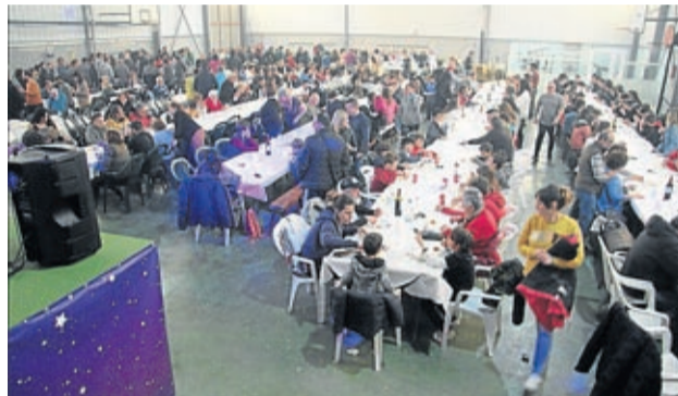
Más de 500 personas se dieron cita en el pabellón.

LA CRÓNICA cronicas@aragon.elperiodico.com