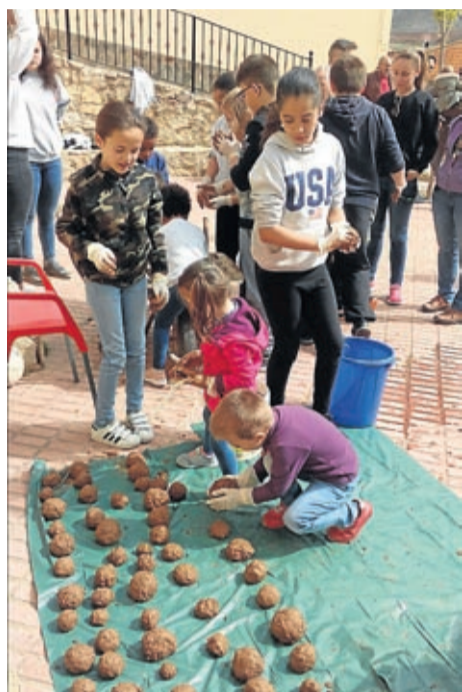
Los niños prepararon bolas de semillas.

También por la mañana los pequeños disfrutaron de un cuentacuentos en el que participaron pintando y cantando y, para terminar el día, los mayores tuvieron su actividad, una sesión de defensa personal que resultó muy interesante y amena quedando todo el mundo con ganas de repetir. ■