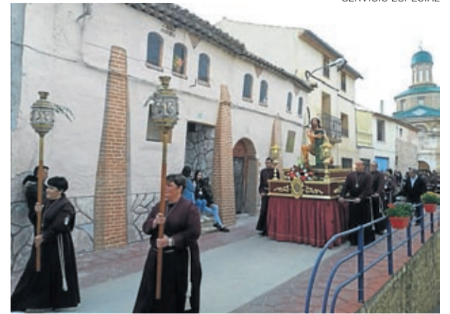
Jesús atado a la columna fue el último paso en incorporarse.

El próximo año, la trigésima edición de este Encuentro de la Amistad se celebrará en Moyuela. ■