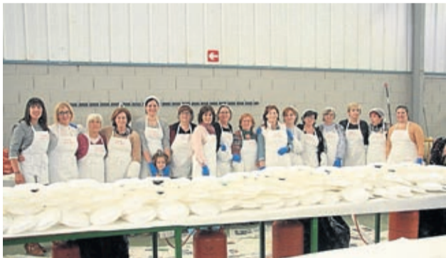
La cofradía se encargó de preparar los huevos fritos.