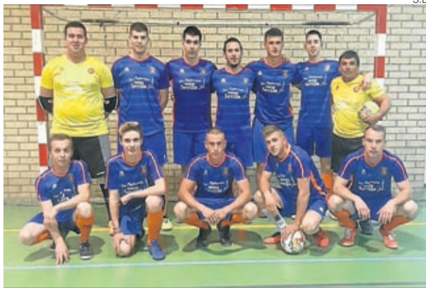
El Eclipse FS, de Lécera, se ha proclamado campeón.

Por otra parte, reseñar que el equipo Belchite 2018, de nueva creación esta temporada, ha finalizado la fase regular en séptima posición. ■