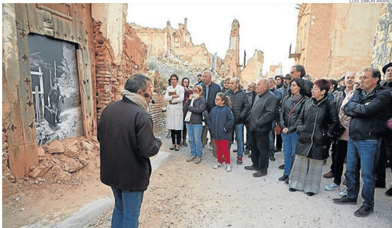
Las fotografías de gran formato de Gervasio Sánchez están estratégicamente colocadas en edificios del pueblo viejo.

Con esta muestra se ha reabierto el teatro «inacabado» construido en 1954