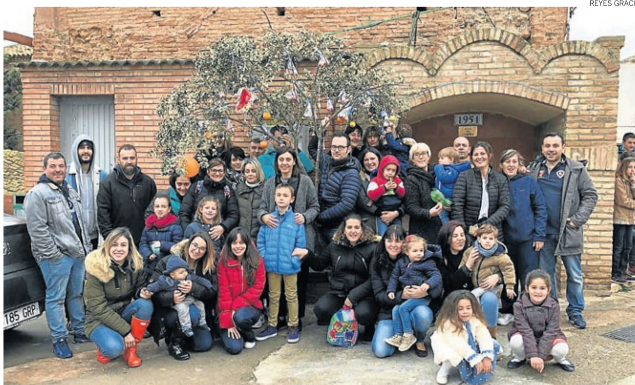
Padres e hijos participan activamente en esta dulce tradición con años de historia en Plenas.

Además, este año como novedad se colocó un gran ramo en la plaza de Manuela Sancho y repartieron chucherías a todos los niños asistentes y, pese a que la mañana resultó desapacible, hubo una gran participación. ■