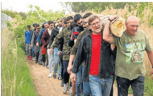
Los vecinos portaron a hombros el gran chopo.

Más de 500 personas participaron de esta tradición el Sábado Santo