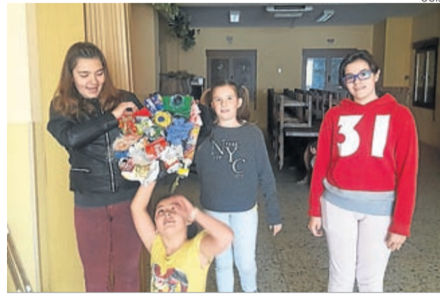
Con material recuperado y reciclado se está creando arte.