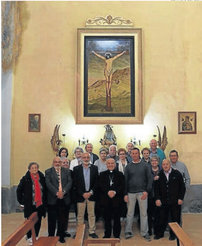
El autor, autoridades y vecinos, bajo el lienzo de Cristo crucificado.