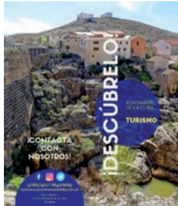
Parte del nuevo folleto.

Justo antes de la Semana Santa se puso en marcha este nuevo servicio de visitas guiadas a la presa romana, su