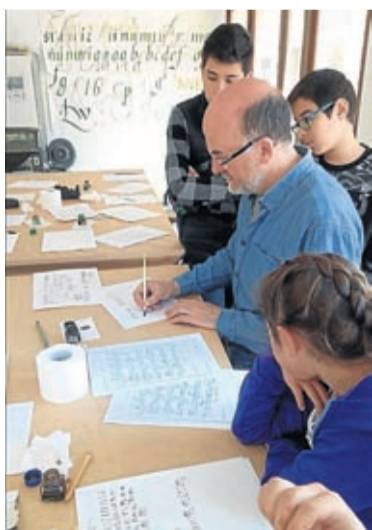
Taller de caligrafía histórica.

Además, también se pudo disfrutar de un Taller de Caligrafía Histórica, que bajo el título Las escrituras en