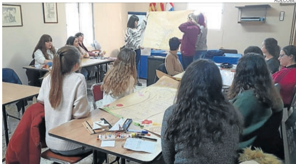
El primer curso fue el de Monitor de tiempo libre que se impartió en Moyuela.

El primero de los cursos fue el de Monitor de tiempo libre, que comenzó el 2 de marzo en Moyuela y se extendió hasta el 28 de abril. 150 horas teóricas, que se complementarán con 160 horas en prácticas que las doce alumnas inscritas podrán realizar en ins-