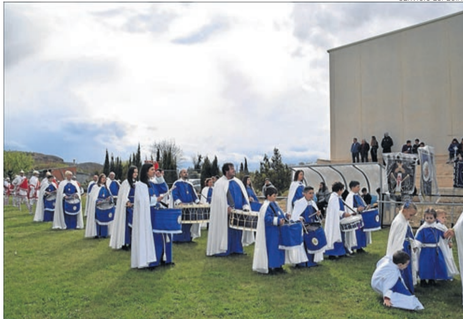
Ni siquiera la lluvia impidió que sonaran los tambores, bombos y cornetas con gran fervor.

La tarde transcurrió entre los sonidos de tambores, bombos y cornetas en las instalaciones del Campo de Fútbol Municipal y ni siquiera la lluvia, una invitada poco deseada para este tipo de ocasiones, pudo apagar los sonidos que con fervor, los más de 300 cofrades de los distintos pueblos regalaron a todo el público asistente.