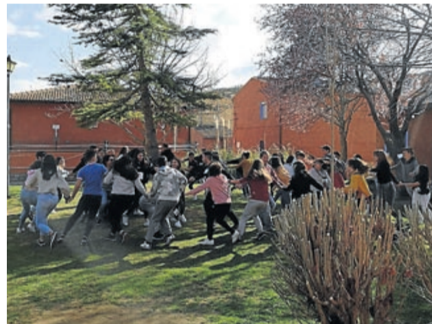
Tres jóvenes de la comarca participaron en el encuentro de Anento.

uno de ellos una parte de la misma, a modo de puzzle, que luego habrá que juntar para ver el resultado que reproducirá una gran tortuga hecha con los residuos recogidos y el material reciclado generado en los hogares de los jóvenes.