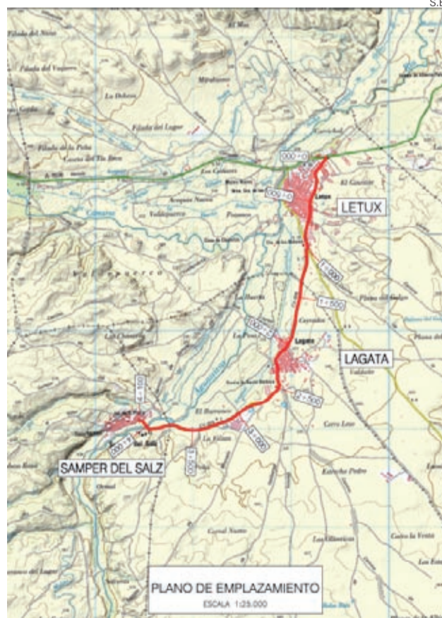
Plano de situación del tramo afectado por el proyecto.

La ejecución de dicho proyecto está valorada en 693.150,69 euros (IVA incluido). ■