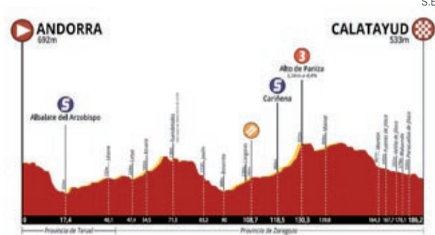
Alzado de la primera etapa de la Vuelta Ciclista a Aragón.

La actividad contó con la del Ayuntamiento de Belchite y la Comarca Campo de Belchite, además de más de 30 empresas. ■