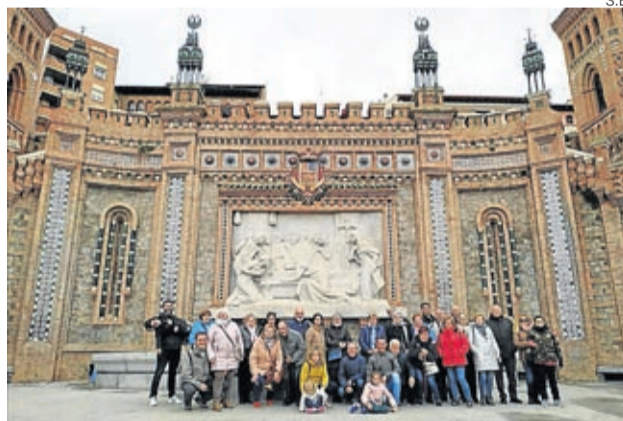
Los vecinos disfrutaron del Mudéjar de la capital turolense.

y estrechar lazos entre vecinos. En esta ocasión, el nutrido grupo de vecinos que participó en el viaje pudo disfrutar de una jornada que les llevó hasta la capital turolense y hasta uno de los municipios más bellos de España, Albarracín. ■