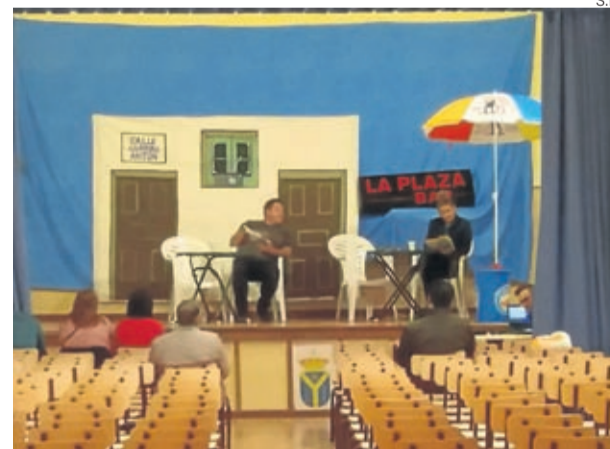
Uno de los últimos ensayos de la representación.

Un año más un grupo de actores locales representó varias piezas por San Jorge