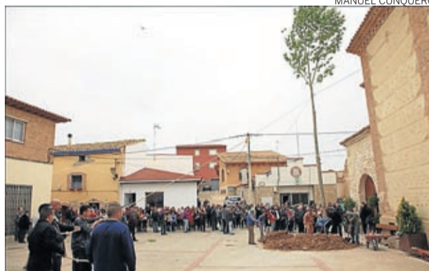
Ayudados por cuerdas, el chopo se plantó ante la iglesia.