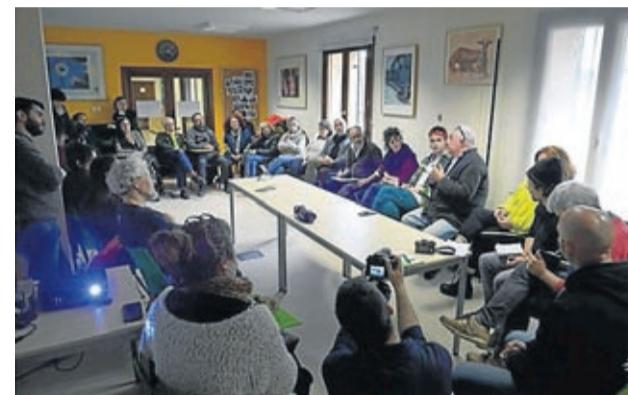
También hubo talleres y un encuentro de poesía rural.