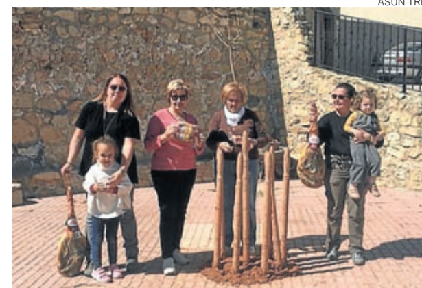
Campeonas y subcampeonas del campeonato de birlas.

Ya por la noche, la cofradía alargó la animación con un disco móvil a cargo del que fuera conocido presentador de Los 40 Principales, Fernando