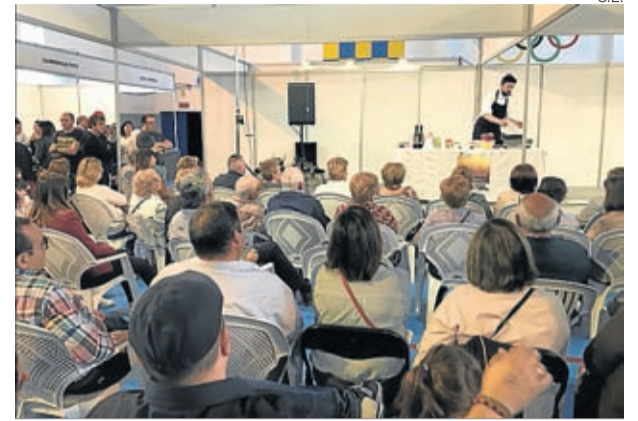
La feria cuenta con una variada oferta comercial y de servicios.