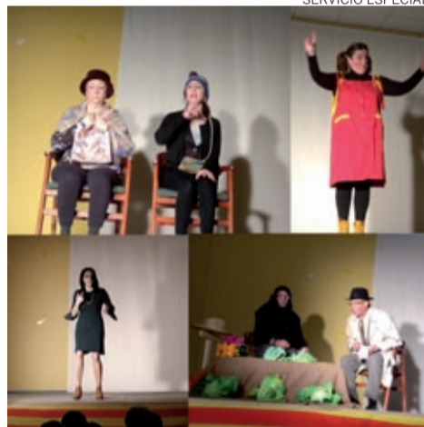
Los actores representaron sketches y monólogos.

El grupo de teatro volvió así a sentir sus cosquillitas y la emoción de estar nuevamente juntos, compartiendo de nuevo momentos de tensión, nervios y complicidad entre ellos. El ensayo final y prepa-