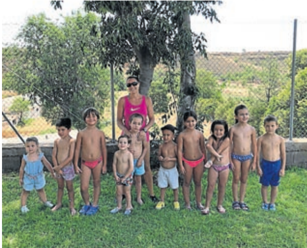
Los niños han aprendido en el cursillo de natación.