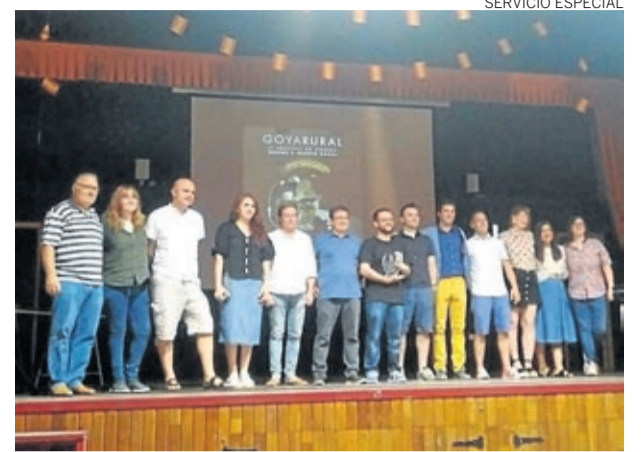
Premiados en el II Festival Goya Rural.

www.goyazaragoza.com/. Actualmente ya están abiertas las inscripciones en el IV Concurso de Pintura de Cámara Zaragoza, y la III edición del concurso la Aguja Goyesca para diseñadores de moda. ■