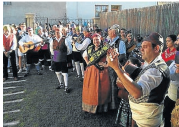
La ronda jotera contó con grandes voces.

es la puesta del pañuelico a los nacidos entre el 1 de enero del 2018 y el 15 de ju-