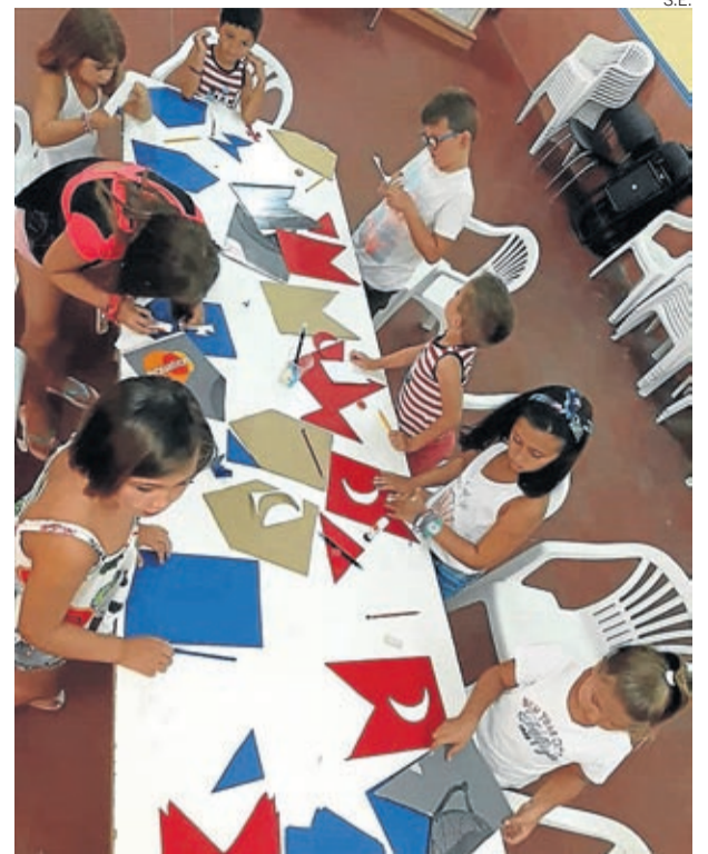
Grandes y pequeños elaboran banderines azules y rojos.