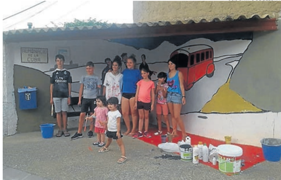
La marquesina de autobús de Almonacid es ahora mucho más alegre.