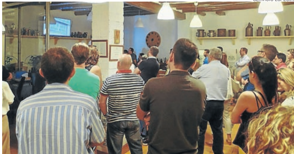
Almazara Molino Alfonso organiza visitas a sus instalaciones de lunes a sábado.