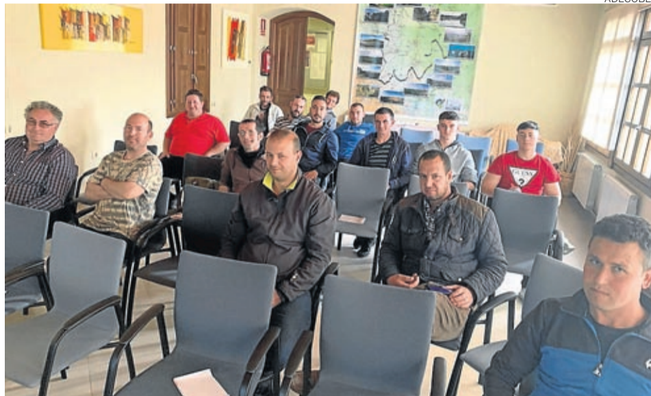
Adecobel ha propiciado la realización de 25 cursos formativos.

Como datos positivos, tenemos el aumento de afiliacio-