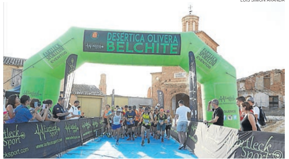
Alrededor de 110 corredores tomaron la salida de la prueba,

vidades deportivas como deportes colectivos, deportes de ruedas, atletismo, juegos de agua, bádminton o también datchball. ■