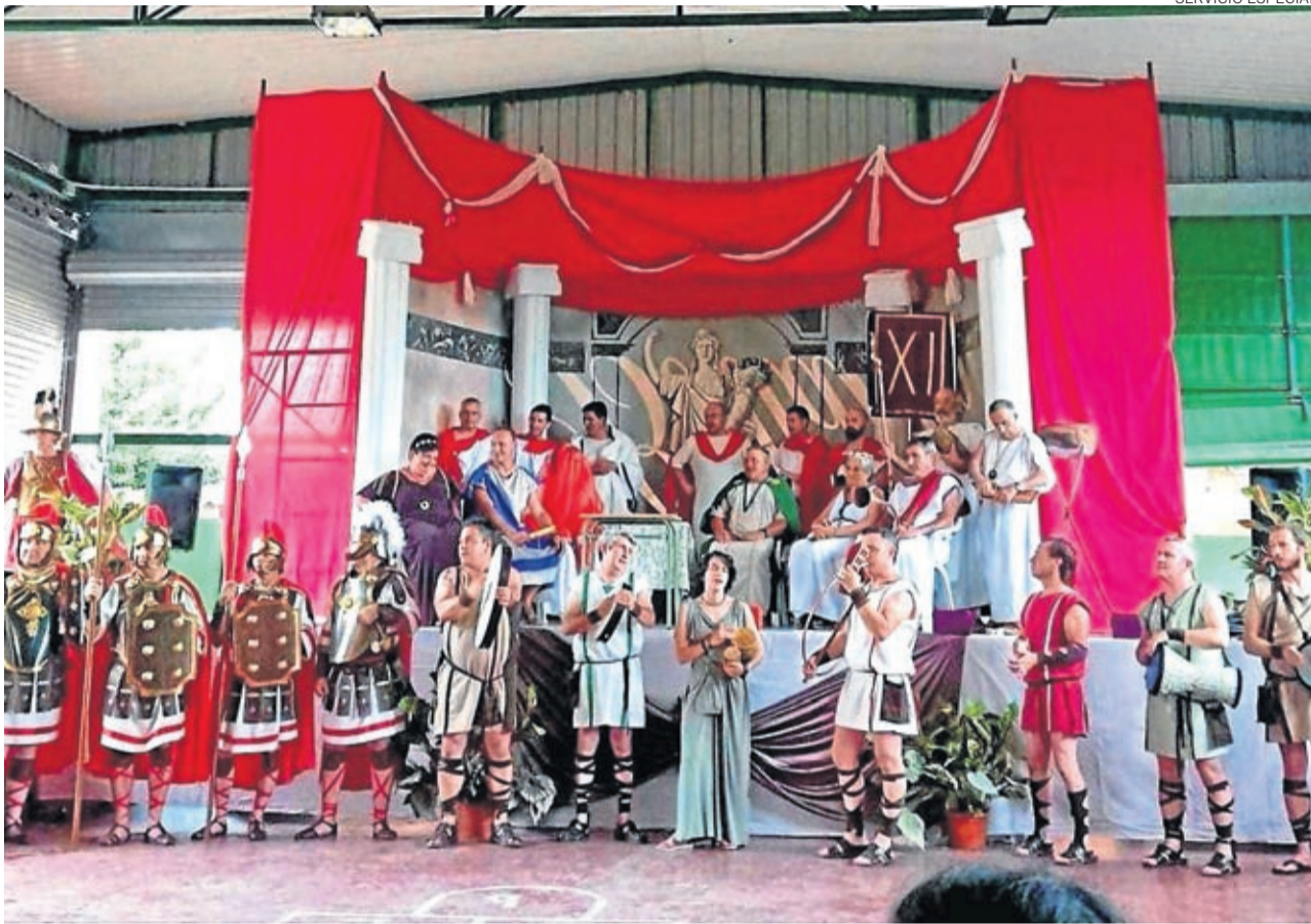
Los principales protagonistas de la Boda Patricia estrenaron vestuario creado por la asociación Albajar.

LA CRÓNICA cronicas@aragon.elperiodico.com