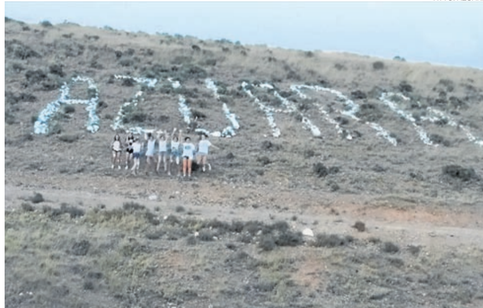
En Azuara varios jóvenes pintaron las piedras de las letras que forman el nombre del pueblo.