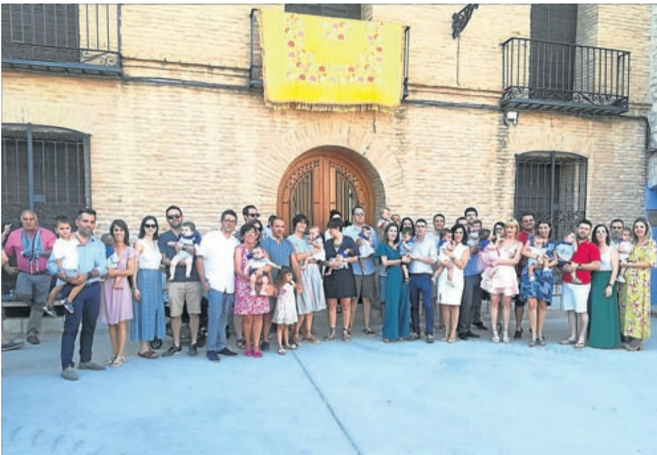
Una quincena de pequeños leceranos recibieron por primera vez el pañuelico.