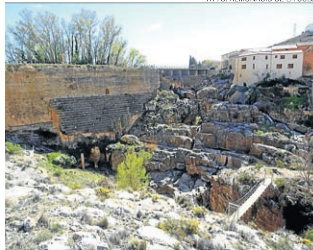
Las pasarelas se han convertido en todo un reclamo.

vierno que será el siguiente: la oficina de atención turística abrirá los sábados de 11.00 a 14.00 y de 16.00 a 18.00 horas y los domingos de 11.00 a 14.00 horas, y las visitas guiadas se realizarán los sábados a las 12.00 y a las 16.00 horas y los domingos a las 12.00 horas.