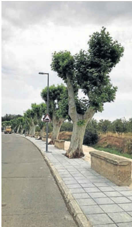
La calle San Ramón tendrá una amplia acera.