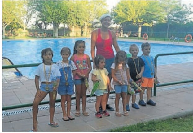
SERVICIO COMARCAL DE DEPORTES

El mes de julio ha sido el mes de las actividades acuáticas en la comarca Campo de Belchite. Se han realizado los tradicionales cursos de natación, con un total de 140 participantes en las localidades de Belchite, Lécera, Codo, Letux, Samper, Plenas,