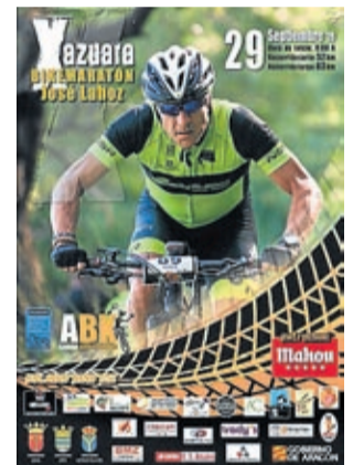
Cartel de la prueba.

Desde el 5 de agosto están abiertas las inscripciones para la edición de 2019, la cual se celebrará el domingo 29 de septiembre. Existen dos recorridos: uno corto de 52 kilómetros y otro largo de 83 kilómetros. Por fechas seguramente sea una de las últimas citas del año donde tantos amantes del ciclismo se unan