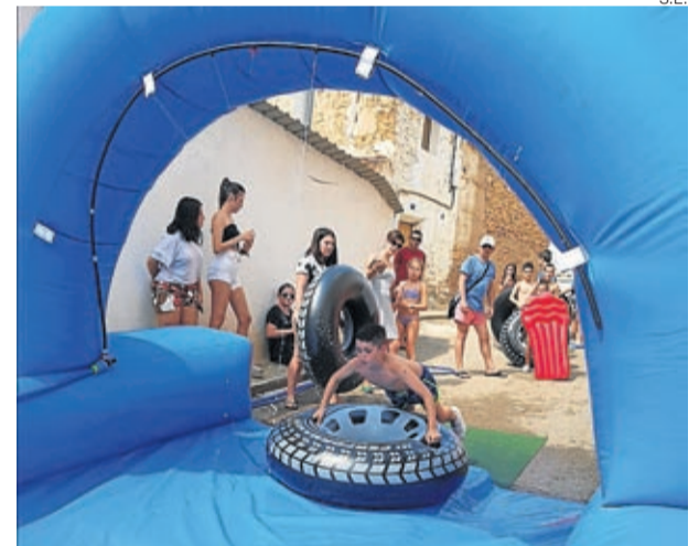
Entre otros, organizó un gran tobogán acuático.

Este año la Comisión de Fiestas de Moyuela está imparable. Durante el mes de julio ha realizado un gran trabajo organizado diferentes actividades como el tobogán acuático gigante del que pudieron disfrutar los moyuelinos el 20 de julio. Algunos estaban impacientemente