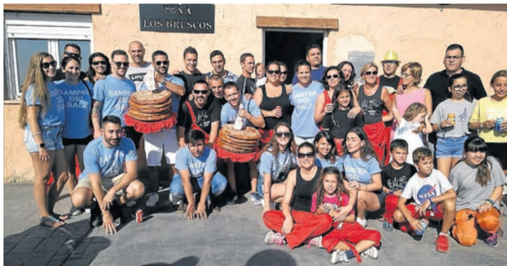
Los miembros de la comisión fueron los encargados de recoger las tortas.

Además, también se realizaron la clásica chocolatada y las migas, el toro de fuego, los hinchables y fiesta de la espu-