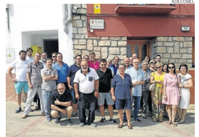
El primer encuentro de asociaciones tuvo lugar en Lagata,

El resultado fue muy positivo, todas las asociaciones mostraron su interés en continuar con esta iniciativa y se quedó fijada la fecha del 7 de septiembre en Almonacid de la Cuba para un nuevo encuentro. ■