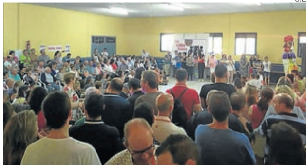
El centro social se llenó de público.

El grupo moyuelino, Los Gallos Stones deleitó con canciones de grandes grupos como Los Brincos o Los Diablos a las que el público respondió con aplausos y entusiasmo, ya que pese al nerviosismo por la ac-