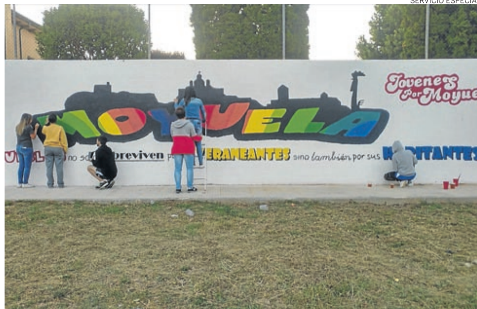
La Asociación de Jóvenes por Moyuela ha pintado un mural en la pared de las piscinas.