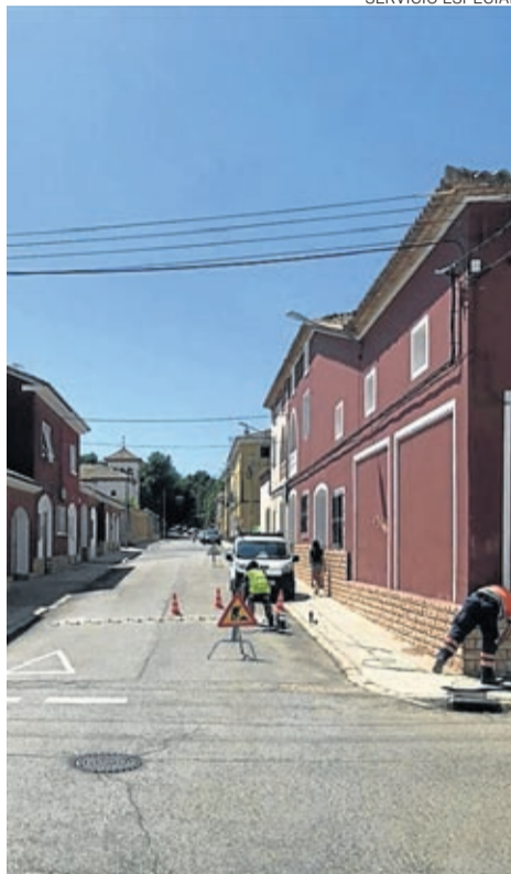
Banda de velocidad en la calle Santa Ana.

na muy transitada por los vecinos que quedará lista para mediados de agosto.