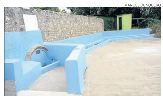
La fuente luce una imagen renovada.

El consistorio ha adecentado y pintado con fondos propios la fuente ya que desde que se hizo no se había tocado. Ahora, queda pendiente actuar en la otra fuente del municipio que se encuentra en el lavadero. ■