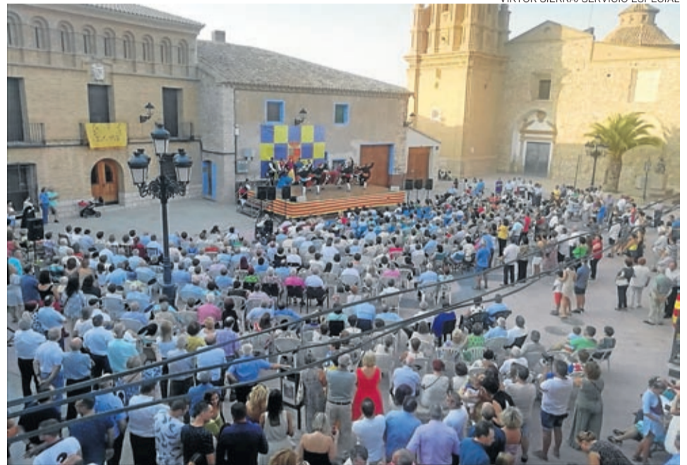
La plaza se llenó para asistir al magnífico festival de jotas.