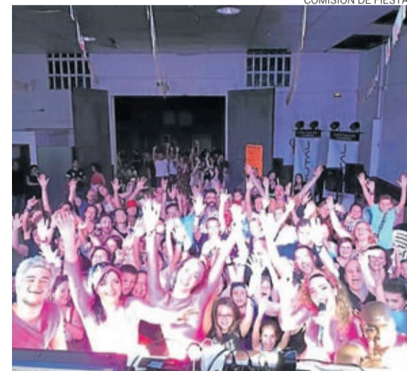
La disco móvil congregó a muchos vecinos.

re agradecer el esfuerzo de todo el pueblo y de los ayudantes de comisión, ya que sin ellos no habría sido posible disfrutar de estos días. Y avi-