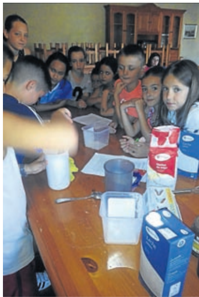
Taller de crepes dulces y saladas.

Comarcal de Información Joven se realizaron en PLENAS dos KEDADAS, la de julio en la que los participantes aprendieron a elaborar unas deliciosas crepes y la de agosto en la que realizaron distintos juegos en el frontón. ■