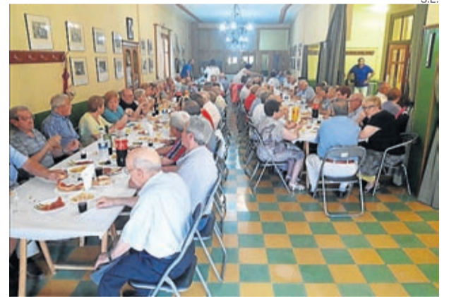
Tuvieron una merienda y actuación musical.

calidad con unos banderines azules (cristianos) y rojo (moros). Para ello, se contó con la ayuda de los más pequeños que durante el ludoverano colaboraron en la elaboración de los mismos y también con la ayuda de aquellos vecinos que acudieron a la llamada que se hizo para la tarde del 8 de agosto. ■