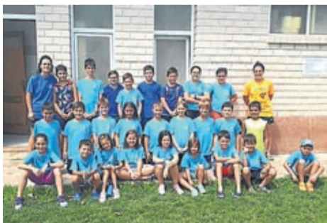
Participantes en el campus de Lécerca.