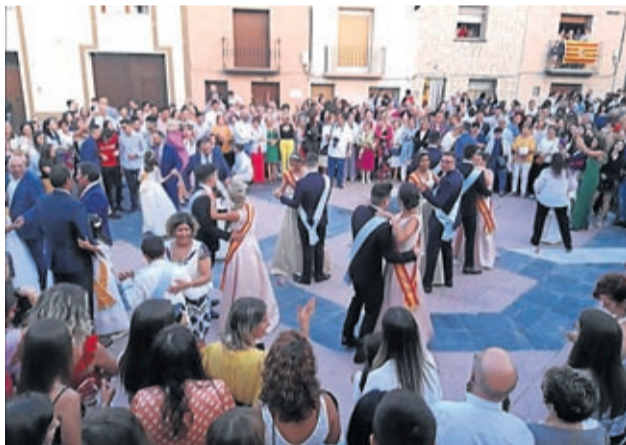
Reinas y majos bailaron ante sus vecinos.

La diversión y el jolgorio se adueñaron de las calles y plazas de Lécera entre el 26 de julio y el 5 de agosto. Entre esos días, los vecinos y visitantes disfrutaron de la amplia programación impulsada desde la Comisión Interpeñas 2019 para celebrar las fiestas de Santo Domingo de Guzmán en las que no faltaron numerosos espectáculos y actuaciones musicales de gran nivel, los festejos taurinos o la tradicional ronda jotera en la que destacaron voces muy buenas de Teruel como las de Teodoro Biel, Isidro Claver, Blas Rando y Lucía Claver.