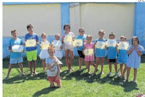
En Belchite, los niños muestran su diploma.

Este verano se ha realizado el campus multideporte comarcal en las localidades de Lécerca y Belchite donde participaron 40 niños y niñas en