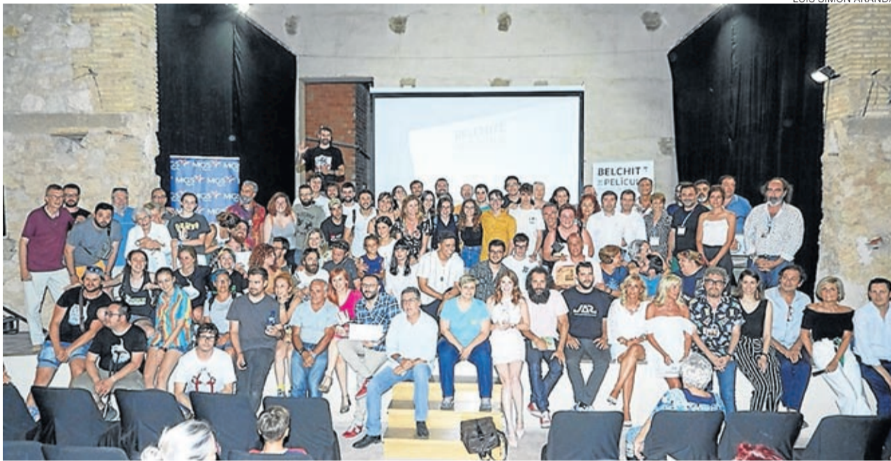
Foto de familia de ganadores, organizadores y juradi de la II edición del certamen 'Belchite de película' / '24 horas de cine exprés'.

A. REVUELTA arevuelta@aragon.elperiodico.com