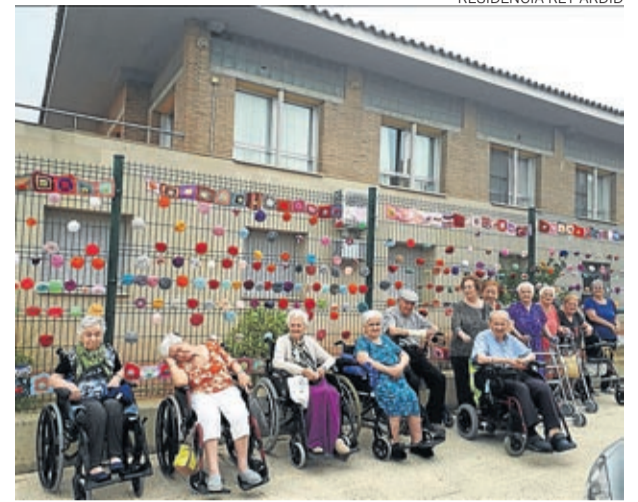
La valla del centro luce una imagen renovada.