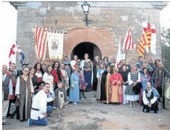
Los vecinos se visten de época para la ocasión.

Un año más, y ya van 14, Moyuela se engalanó para la ocasión decorando sus calles, adornando balcones y ventanas mientras sus vecinos salían vestidos de época para participar en una fiesta en la que volvió a destacar el gran desfile inaugural en el patio del Castillo con la ofrenda de flores a San Jorge y el traspaso