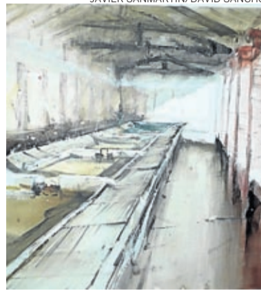
Fragmento del cuadro ganador.