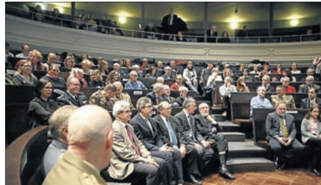
La gala de entrega tuvo lugar en el Paraninfo de la Universidad.