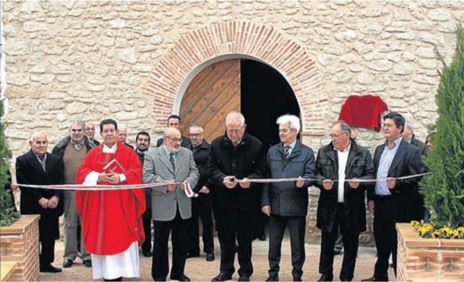
Las autoridades cortaron la cinta inaugural de la restauración de la ermita.