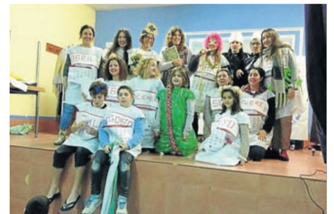
Los niños de Codo protagonizaron un teatro.