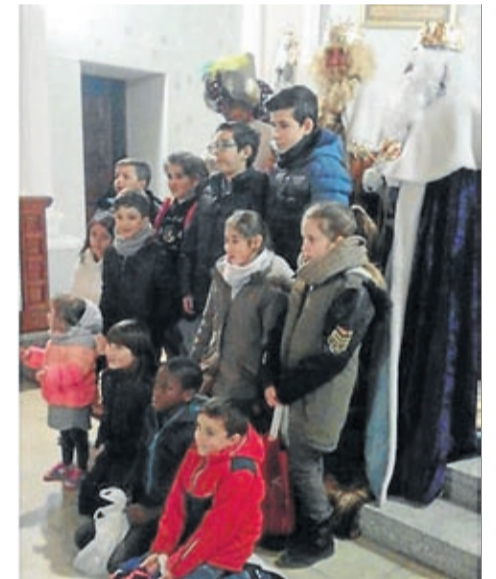
Niños y Reyes Magos en Fuendetodos.