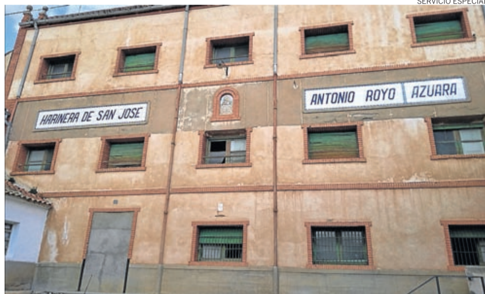
La Harinera de San José de Azuara es un extraordinario espacio que se conserva bastante bien.