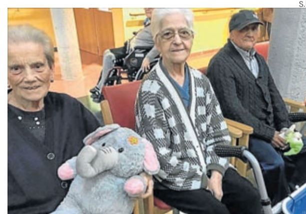
Los residentes recibieron entusiasmados los regalos.

Las inscripciones se podrán realizar hasta el miércoles 6 de marzo en www.clubibon.es , donde también se puede encontrar más información sobre la prueba. ■