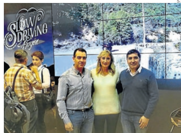
Representantes del Ayuntamiento de Belchite en Fitur.

mo para la de los ciudadanos. Tambi n es una medida que contribuye de forma decisiva a luchar contra la despoblaci n, ya que ayuda a mantener e impulsar nuevos servicios en el municipio. ■