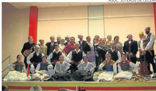
Los joteros ofrecieron un variado festival.