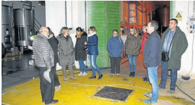
La junta visitó la Cooperativa Ntra. Sra. del Olivar.

Pero antes de la reunión, los miembros de la junta directiva aprovecharon para visitar diferentes proyectos beneficiados con ayudas Leader, una práctica que permite conocer de primera mano a las personas que hay detrás de las solicitudes de ayuda, las inversiones ejecutadas y el re-