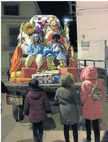
Cabalgata de Reyes de Codo.