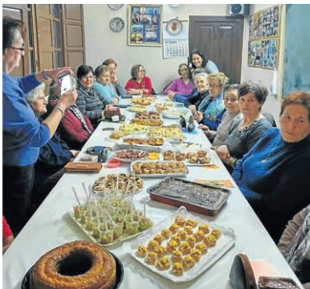
En Codo hubo una deliciosa degustación de postres.