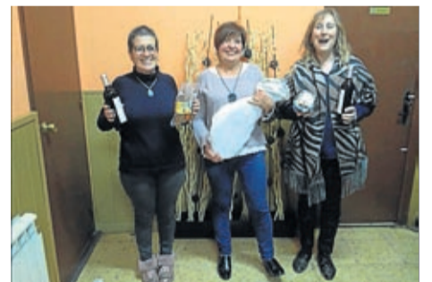
Campeonas y subcampeonas de rabino.