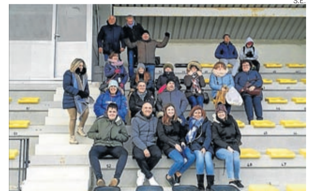
La afición nunca falla al Atlético Belchite.

Las inscripciones se pueden realizar hasta el 10 de marzo a través del enlace en Google/senderistas de Belchite. La cuota es de 12, 15 o 18 € según el participante o la ruta que realice y la misma incluye avituallamientos, comida, seguro de accidentes individual y camiseta. Para cualquier consulta escribir a senderistasbelchite@gmail.com. ■