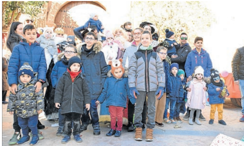
Decenas de pequeños moyuelinos aguardaron la llegada de Sus Majestades.