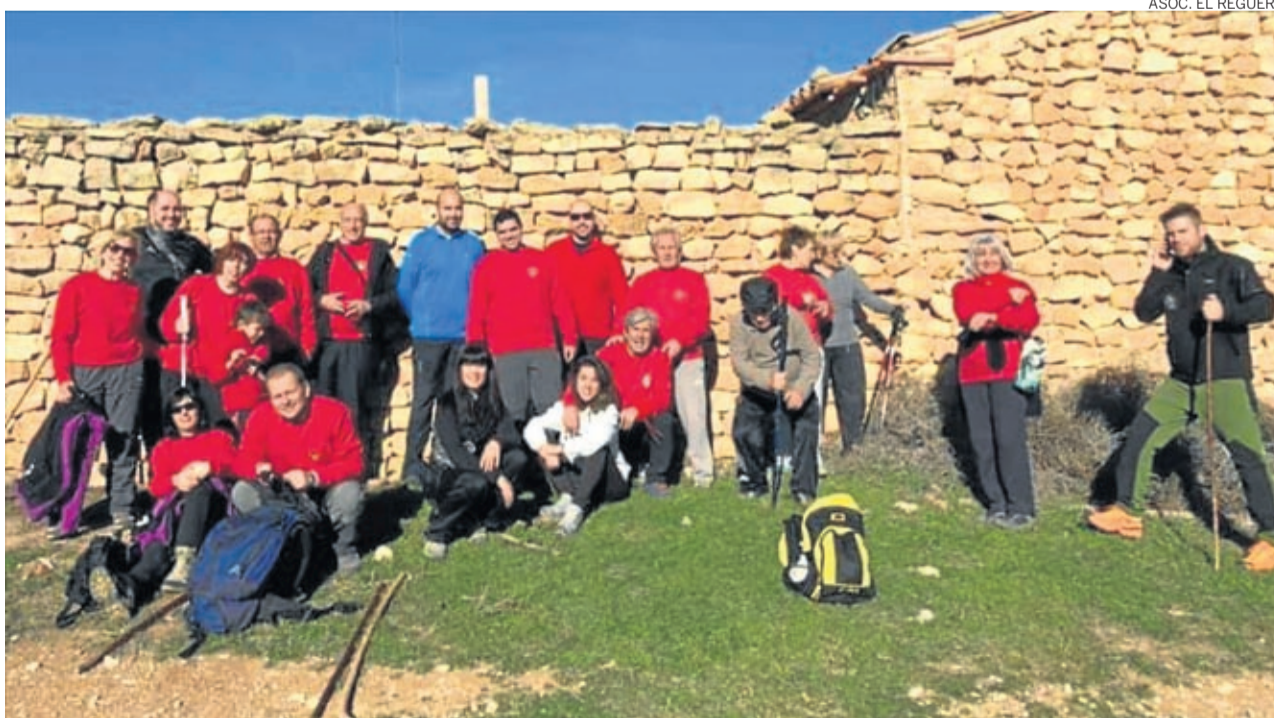
La andada de invierno tuvo lugar el 26 de enero y acabó con una comida y roscón de San Valero.

Ahora a preparar para Semana Santa la andada para los chicos que finalizará con un rico chocolate y la de verano de la cual se ira informando. ■