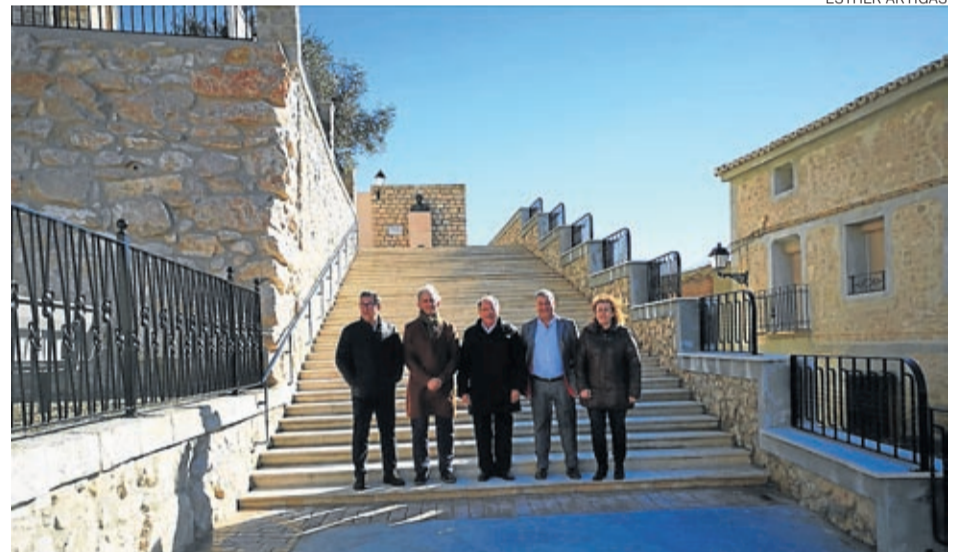
Varios alcalde y el presidente comarcal asistieron al acto de inauguración.

Rodeada por el bar, el casino y la tienda es una de las zonas más transitada por los codinos y durante años fue punto de encuentro para los festejos taurinos en las fiestas, por ello desde el Ayuntamiento de Codo se consideró que era el lugar idóneo para colocar la escultura de homenaje al Dance de Codo que se recuperó íntegro el año pasado. ■