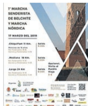
Cartel de la prueba.

La marcha está abierta para todo tipo de público estableciéndose tres recorridos: Chiquifam de 11 kilómetros, mediana de 18 km y larga de 24 km. Estas rutas transcurrirán por distintos atractivos de la zona como son el pueblo vie-