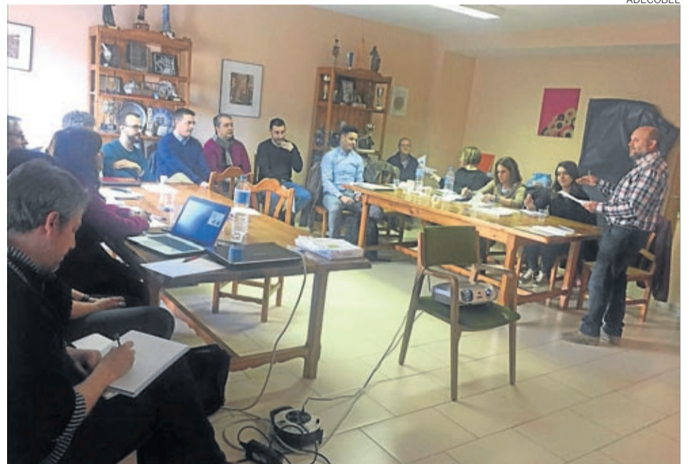
Dentro del proyecto ‘Infoenergía’ se han realizado nueve asesorías y se realizarán más.

El proyecto continúa aier-to y se siguen realizando asesorías. Además, se llevarán a cabo jornadas en las que trabajar por la sensibilización de un consumo responsable y sostenible con el medio ambiente. ■