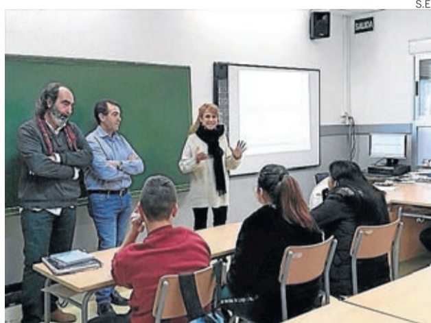
Los talleres se han presentado a los alumnos este mes.

Historia, memoria, valores humanos, futuro... serán conceptos desde los que se invitará a los jóvenes a reflexionar y