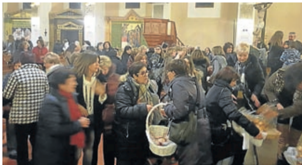
La jornada en Belchite comenzó con una misa.