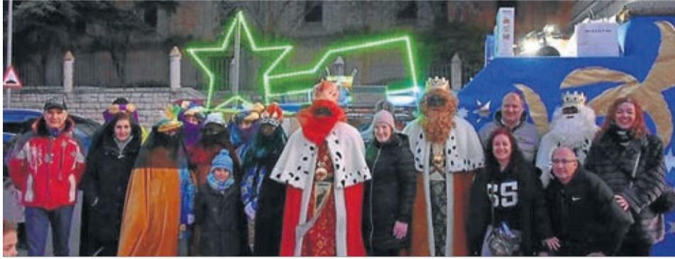
Los niños de Belchite esperaron ilusionados la llegada de los Reyes Magos.