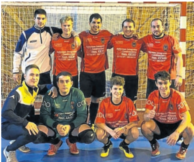
Plantilla de la presente temporada del CD Codo.

Se ha creado la Asociación Deportiva Codina para fomentar el deporte en la localidad