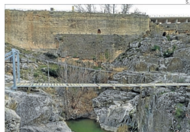
Las pasarelas se inaugurarán el próximo 7 de marzo.

El objetivo que se persigue es que al final de todo el proceso se tenga una visión precisa de cómo sería la villa romana, se conserven y visiten adecuadamente los mosaicos y que todas las obras que se vayan realizando tengan carácter definitivo. ■