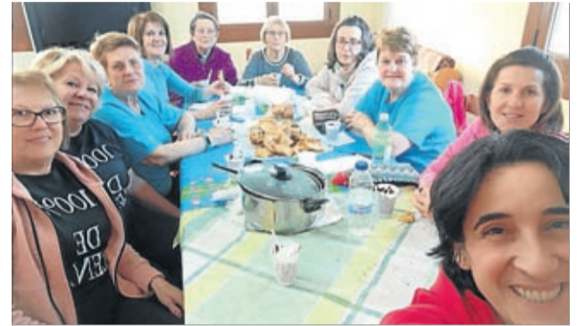
Las mujeres de Plenas merendaron chocolate y tortitas.