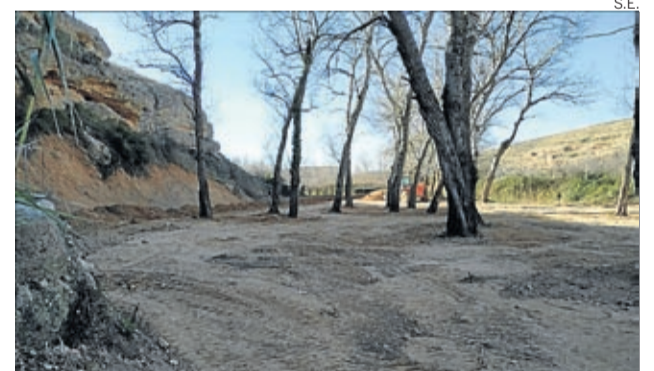
El consistorio ya ha comprado y limpiado los terrenos.

Además, la idea del consistorio es poder completar este parque en un futuro con una zona de acampada, ampliando la oferta turística y de ocio de la localidad. ■