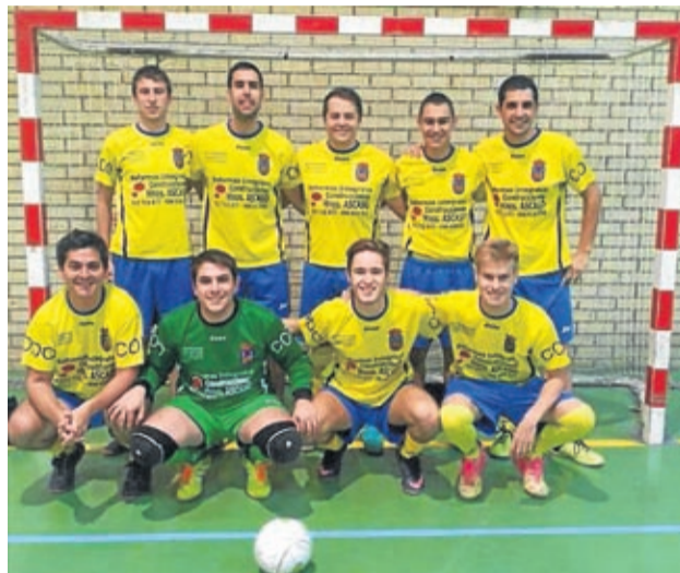
Plantilla de la Liga Comarcal de la temporada 2017-2018.