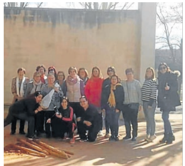
En Plenas se organizó un campeonato de birlas.