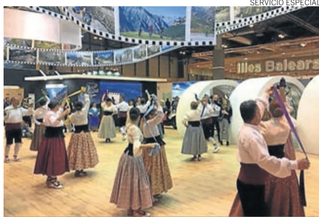
La asociación llevó el Baile de la Cinta a Fitur.

Ahora, en este segundo taller se abordarán otros bailes y danzas populares de di-