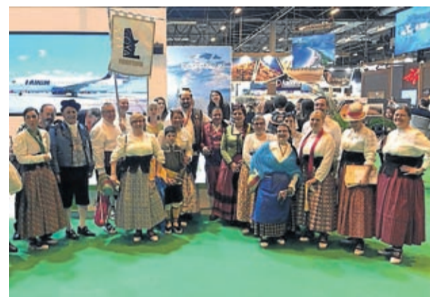
La Asociaci n Goyescos represent  un baile.