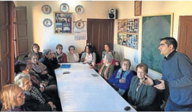
Las amas de casa de Codo organizaron una intensa semana.