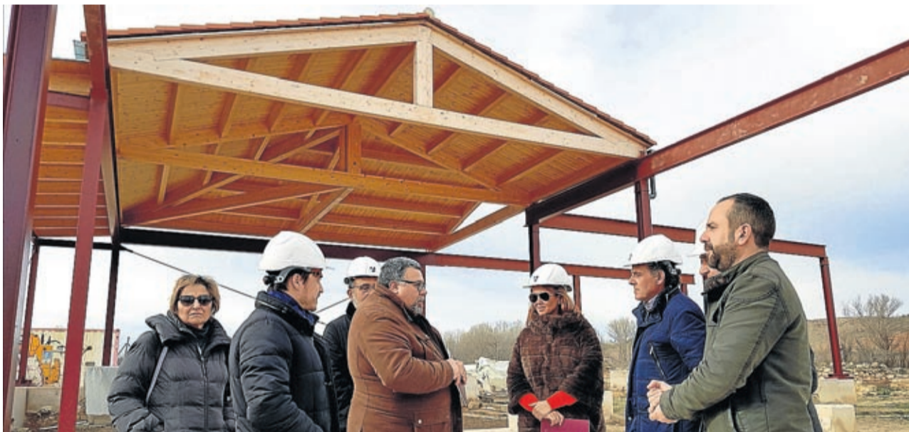
Este año comenzará la tercera fase de este cerramiento que garantiza la protección del yacimiento excavado.

LA CRÓNICA cronicas@aragon.elperiodico.com