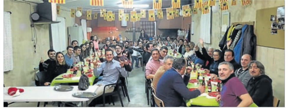
Los vecinos de Plasas se juntaron para Nochevieja.