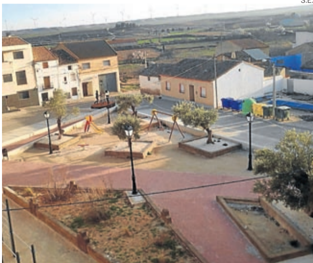
La plaza de El Sol ha sufrido una importante reforma.

El espacio cuenta con zonas de ocio, un jardín y un paseo peatonal