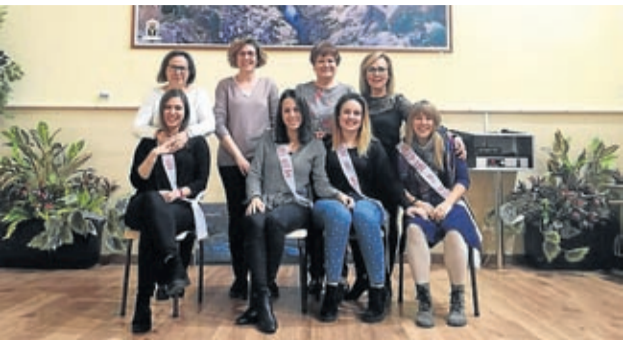
Almonacid eligió a sus 'Águedas' del año próximo.