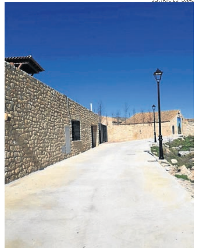
La nueva calle La Aguadora ya se ha pavimentado.

Para los trabajos de pavimentación el Ayuntamiento de Fuentetodos contó con una ayuda económica del Fondo de Cooperación Comarcal del Campo de Belchite, mientras que la instalación del alumbrado se ha ejecutado con fondos propios del Ayuntamiento de Fuentetodos. ■