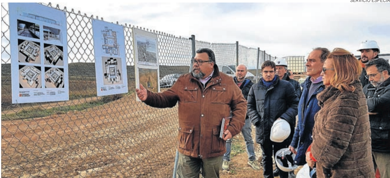
El director del proyecto explicó a la consejera de Cultura y al alcalde de Azuara la evolución de los trabajos.