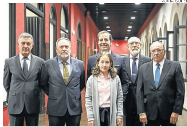
El alcalde de Plenas, con el resto de personas reconocidas.