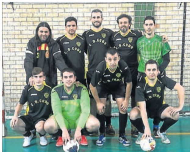
Plantilla de Codo de la Liga de fútbol sala 2018-2019.

«La verdad que fue muy positiva, ya que te permitía relacionarte con todos los jóvenes de la comarca, conocer nueva gente, etc. Terminaban los partidos y el resultado no importaba, nos juntábamos los dos equipos un rato en el bar