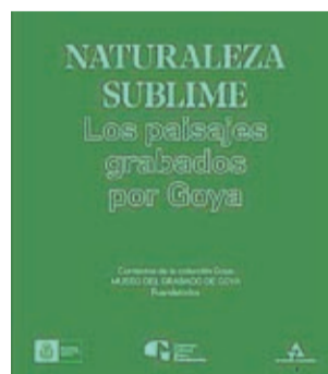
Catálogo de la muestra.

sorcio Cultural Goya-Fuendetodos renueva los contenidos de su Museo del Grabado de Goya. Desde 2016 ha ofrecido a los visitantes la serie completa de la Tauromaquia para conmemorar el 200 aniversario de su primera publicación.