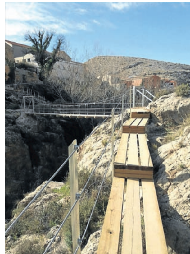
Permitirán ir desde la base hasta la corona de la presa romana.