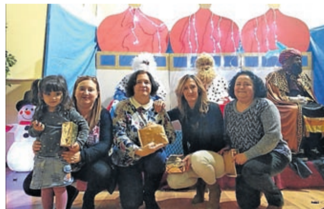
Grandes y pequeños disfrutaron en Almonacid.