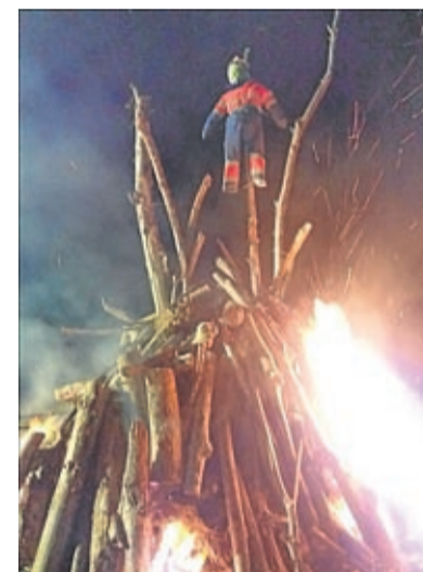
En Almonacid quemaron un muñeco.