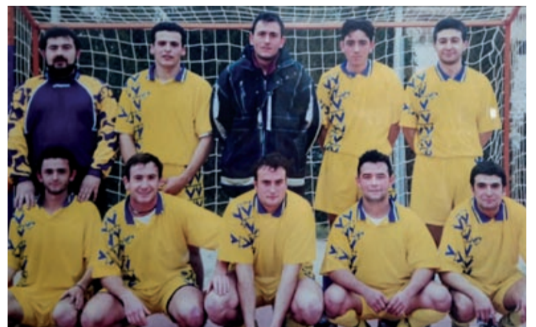
Campeones de Liga 1998-1999 y 1999-2000.

no lo ha hecho ningún equipo en la Comarca). La temporada siguiente volvimos a ganar la liga, perdiendo sólo dos partidos, y la siguiente la perdimos en el último partido. A partir de aquí comenzaron a marcharse varios jugadores al equipo de fútbol 11 de Belchite, y al equipo de fútbol sala