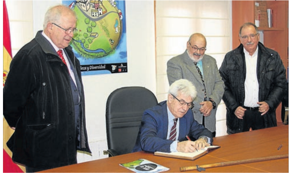
El subdelegado del Gobierno firma en el libro de honor del Ayuntamiento de Lagata.