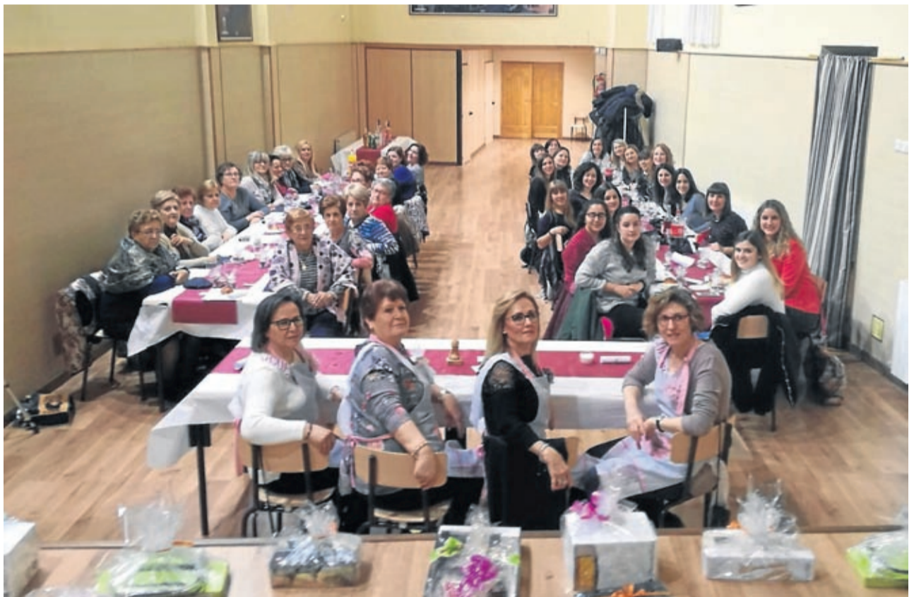
Las mujeres de Almonacid de la Cuba se reunieron en una animada cena.

También en Letux hubo una divertida cena para celebrar Santa Águeda y en Plenas las mujeres disfrutaron de una merienda de chocolate y tortitas a la sartén tras salir de gimnasia. Además, también visitaron a la santa en la iglesia y ya el fin de semana desde la Comisión de Fiestas se quiso rendir un pequeño homenaje a todas las mujeres del pueblo y organizaron una jornada festiva que comenzó con un campeonato de birlas, solo para mujeres, seguido de un vermut y gran judiada para todos los públicos. Además, rindieron homenaje a todas las mujeres con un mural pintado en alusión a la plenense heroína de los sitios, Manuela Sancho, seguido de bingo, karaoke...Y ya por la noche, se llevó a cabo la tradicional cena de mujeres. ■