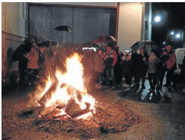
Letux también cumplió con la tradición en honor al Santo.

Mientras, en Moneva se prendió la hoguera ya desde por la mañana y se prepararon unas buenas parrillas de panceta, longaniza, morcilla... regadas con buen vino de la comarca. Por la tarde, el tiempo no acompañó pero no impidió que se asaran unas patatas que se comieron para cenar y todo en un gran ambiente. Y los vecinos de Moyuela también disfrutaron de las ricas viandas en la hoguerica que se prendió junto al centro multiusos. ■