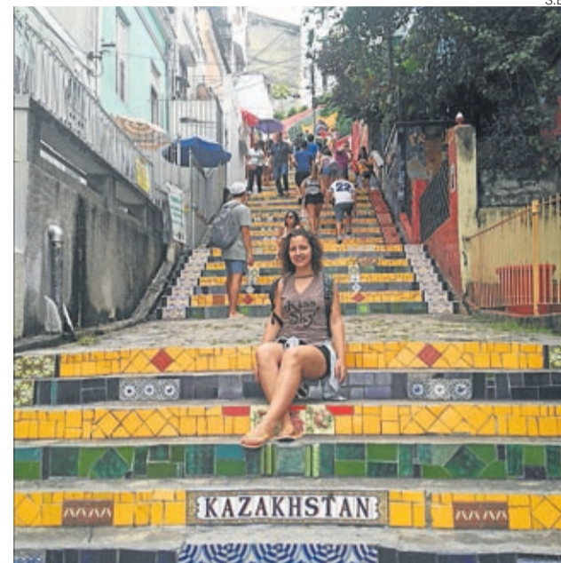
Uno de los ejes del proyecto será restaurar unas escaleras.

Para ello, la iniciativa se basa en tres pilares. En primer lugar se quiere crear un campo de trabajo para restaurar unas escaleras de alto tránsito con la aplicación de azulejos. En segundo término, aprovechando esta rehabilitación se elaboraran unos murales diseñados por un conocido artista local. Y, por último, con estas actuaciones se quiere realzar y promocionar la figu-