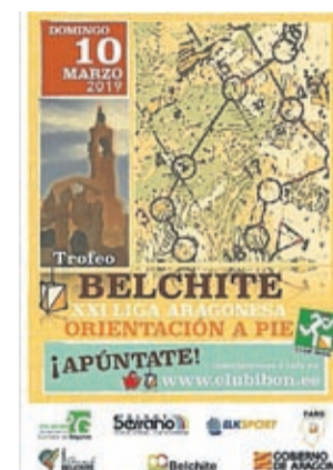
Cartel de la prueba.

La prueba está abierta a todas las categorías desde familiar (formada por una pareja con un adulto mayor de 18 años y niño menor de 12 años), a nacidos en 2017 y posteriores hasta los naci-