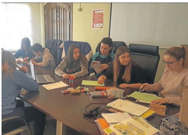
Los jóvenes llevan varias reuniones preparando el proyecto.

También vinculado a este proyecto, en la Kedada Comarcal Móvil (KCM) de febrero se