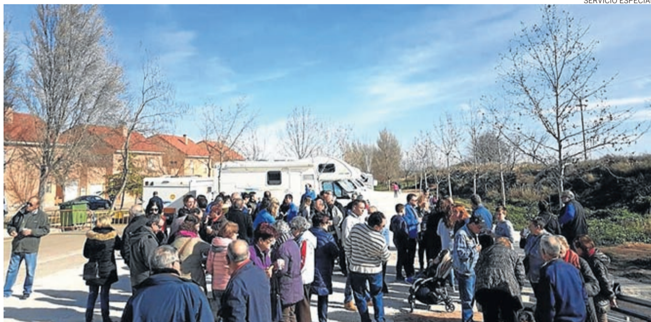
Numerosos vecinos se acercaron a ver el nuevo espacio con capacidad para diez veh culos.

LA CR NICA cronicas@aragon.elperiodico.com