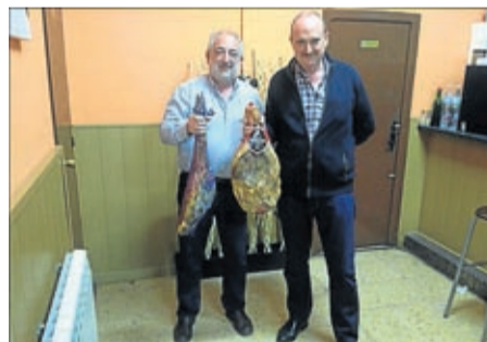
Ganadores del concurso de guiñote.