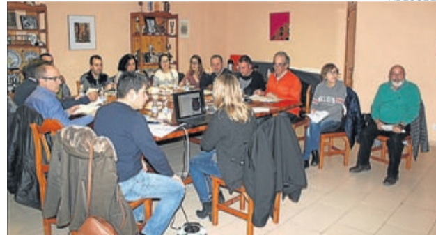
La última reunión de la junta tuvo lugar en Lécera.

na y lavandería de un centro con fines sociales, proyecto no productivo del Ayuntamiento de Lécera. Visitaron también la instalación de un surtidor