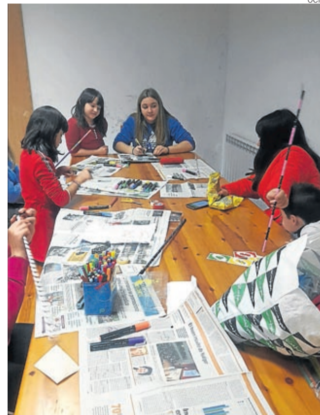
También han elaborado 'palos' para ayudar en la recogida.

El fin de semana del 15, 16 y 17 de marzo es el elegido para realizar las limpiezas de los distintos municipios y en las