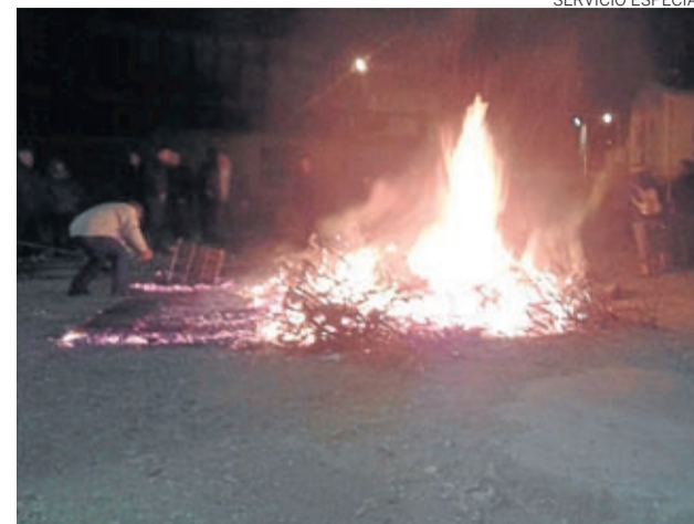
Los moyuelinos degustaron ricas viandas asadas.