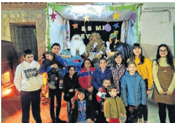
La emoción era visible en la cara de los plasenses.