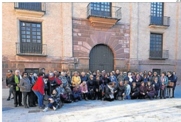
El grupo disfrutó de una excelente jornada.

Seguidamente, el viaje continuó hasta La Almunia de Doña Godina para conocer el Museo del Juego y el Deporte Tradicional El Fuerte. Allí los alumnos pudieron recordar