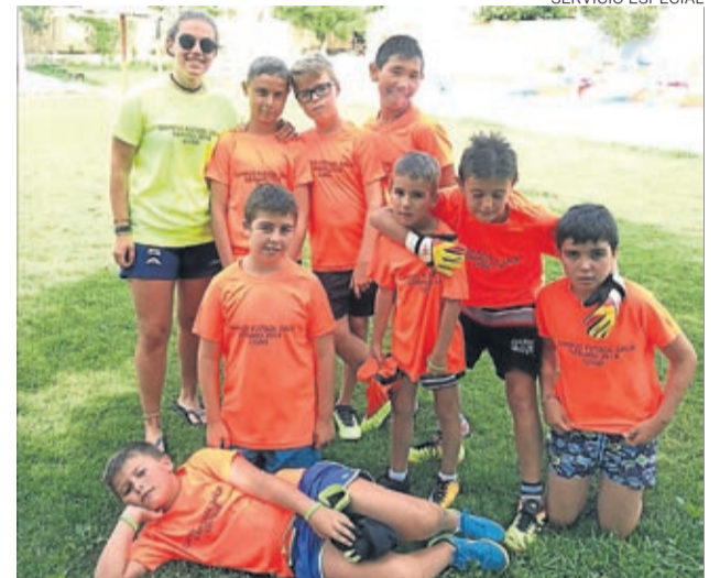
Los más pequeños participaron en el campus de verano.

LA CRÓNICA cronicas@aragon.elperiodico.com