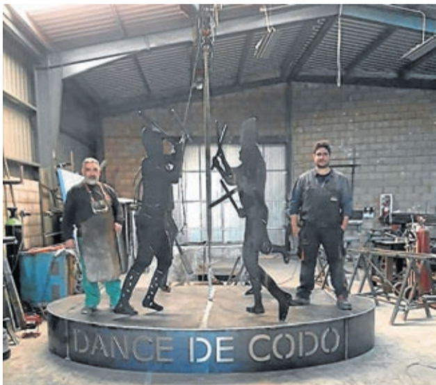
La escultura homenaje al dance es obra del artista Javier Orera.

JAVIER ORERA HA FORJADO EL CONJUNTO EN SU PROPIO TALLER