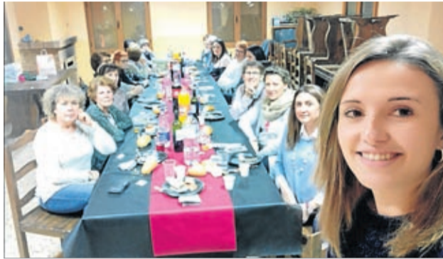
En Letux compartieron una animada velada.