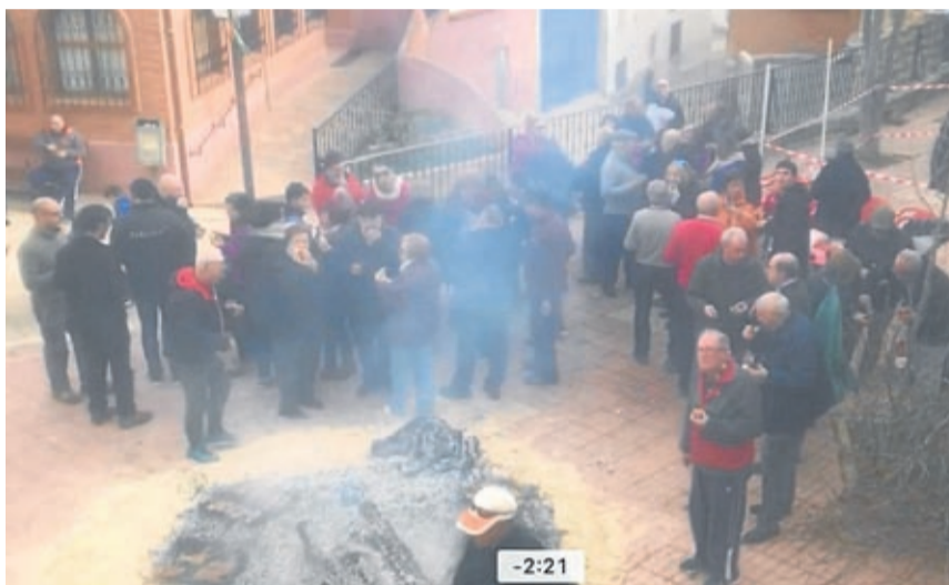
El mal tiempo no impidió celebrar San Antón junto a la hoguera en Moneva.