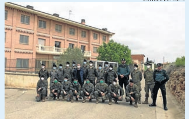
El Ejército ha estado presente en varios municipios.