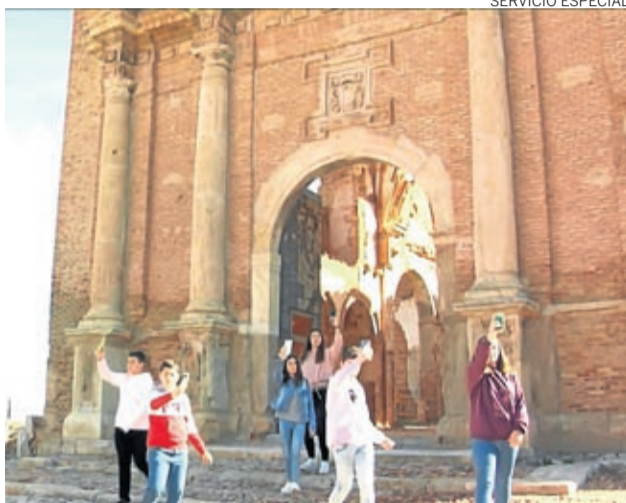
Fragmento del corto ganador del concurso.

El corto, titulado «... matarile, rile, rile», ha sido dirigido por Luis Simón Aranda y José Ramón Mañeru (también guionista), ambos involucrados desde su inicio en el certamen