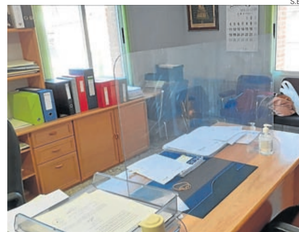
Se han instalado mamparas en los puestos de atención.

que pronto se pueda encontrar la manera de afianzar el terreno, retirar los escombros y asegurar la zona. ■