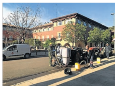
Trabajos de desinfección de las calles.

Solidaridad como la mostrada por la empresa EDP Renovables, con actividad en Belchite, que donó varios ordenadores al ayuntamiento para atender las necesidades de los alumnos del CEIP Belia durante estos días de confinamiento. Equipos que la con-