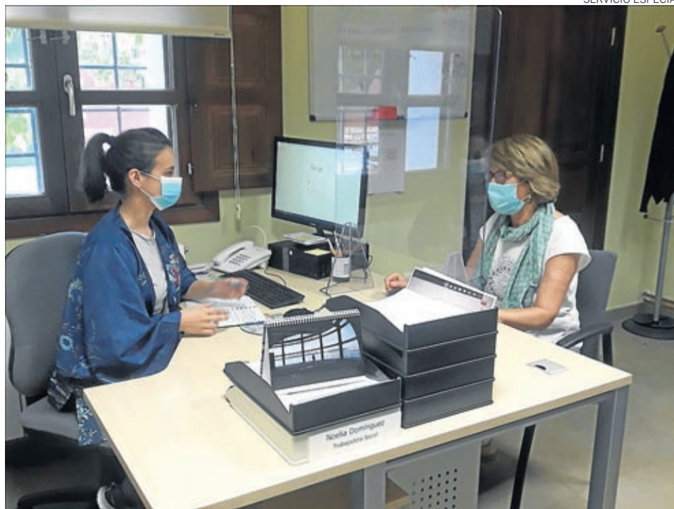
Desde el 1 de junio el servicio social de base ha recuperado la atención presencial.