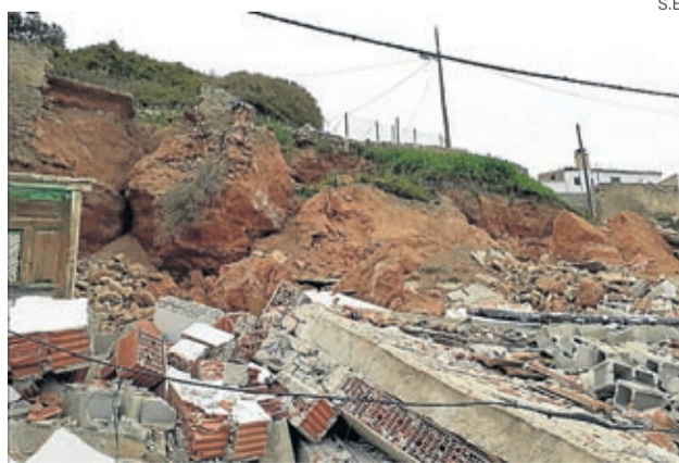
Los escombros aún no se han podido retirar.

El alcalde señala que ya han visitado la zona y estudiado el terreno un ingeniero de bomberos y otro de la Diputación de Zaragoza, así como el arquitecto de la comarca y otro de la DPZ para tratar de encontrar una solución. «La cuestión ahora es que la ladera es muy inestable y si retiras una piedra caen diez