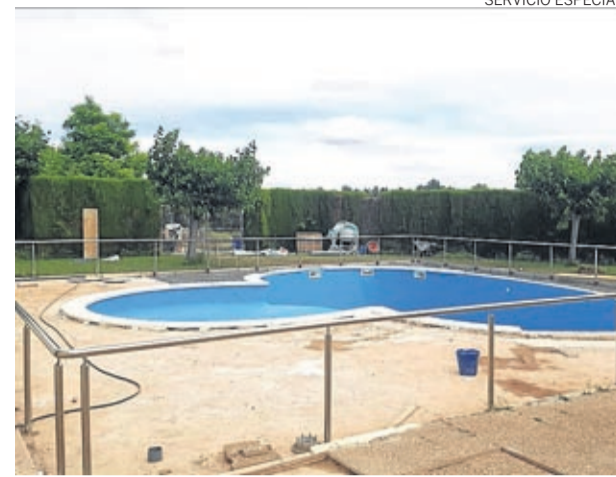
Se han reparado las filtraciones de la piscina.

das las medidas posibles para garantizar la seguridad de su población: desde colocar dispensadores de geles en las oficinas, consultorio, y todos los locales o comercios; el reparto de mascarillas a los vecinos; la instalación de mamparas en los locales médicos e incluso se ha preparado una consulta médica por si se die-