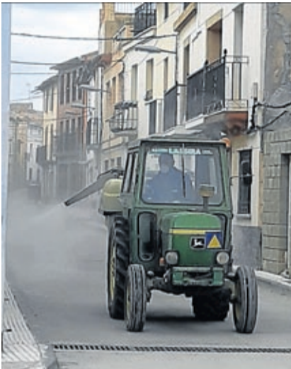
Agricultores ayudaron en la desinfección.