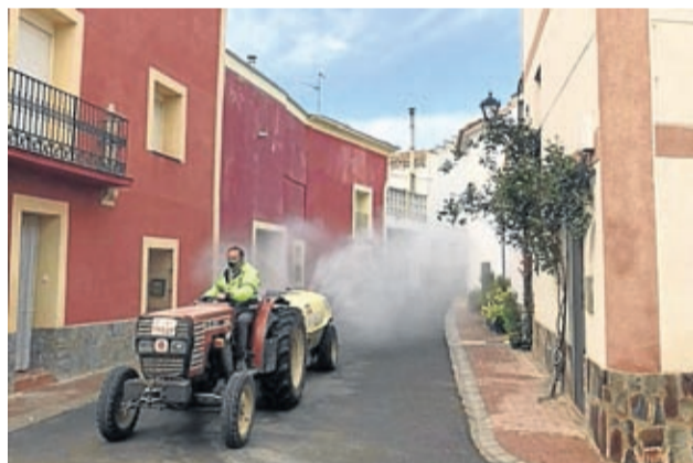
Se han realizado labores de desinfección de calles.

De esta manera, el 1 de mayo los 16 interesados recibieron el pedido y pudieron ponerse manos a la obra en sus tierras.