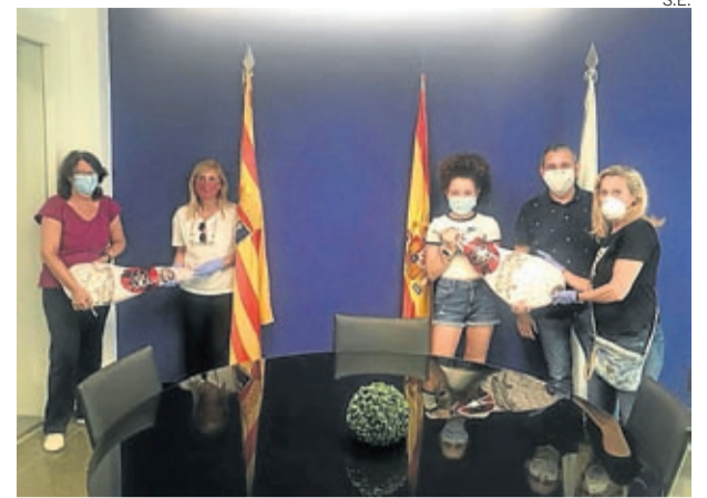
Los ganadores pudieron recoger sus premios.

Será entre los meses de junio y julio cuando los municipios ganadores, entre ellos Belchite, podrán empezar a disfrutar de su #InternetdePelícula en los espacios públicos acordados. ■