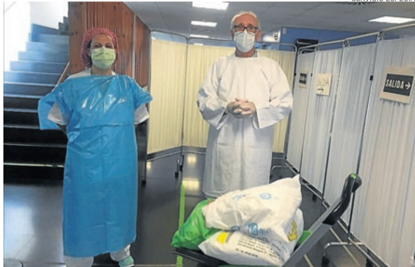
Los sanitarios agradecen las batas y mascarillas hechas a mano.