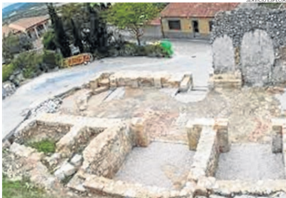
En los últimos tiempos se ha restaurado la Iglesia Hundida que se suma a los atractivos locales.

En este tiempo, el consistorio ha seguido usando Facebook como medio de comunicación con los fuentetodinos para proponerles actividades con las que poder entretenerse. Para celebrar el día de Aragón, el ayuntamiento pidió la