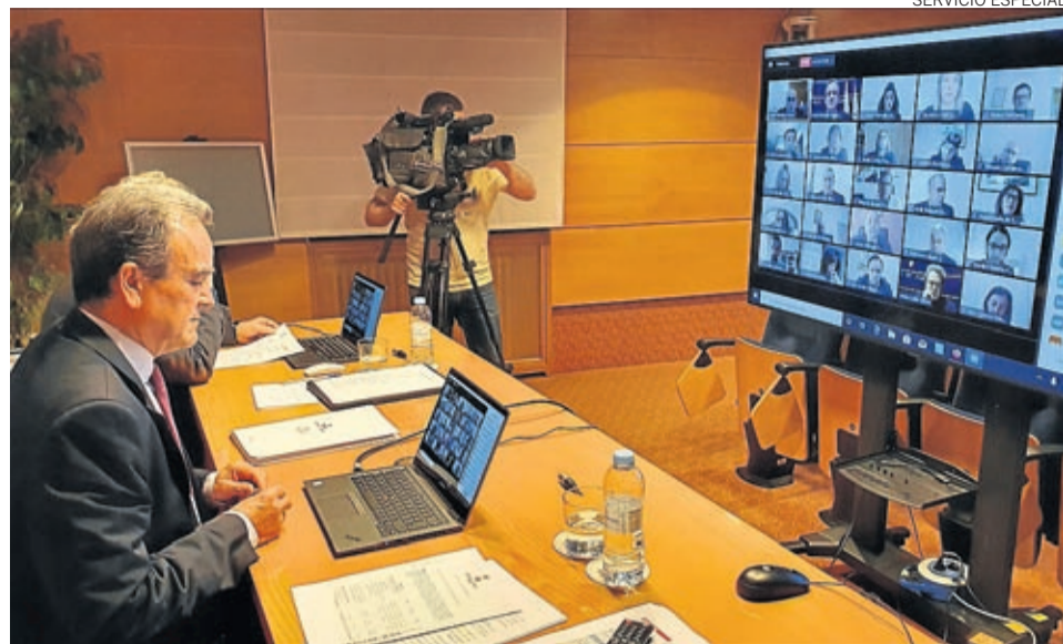
La Diputación de Zaragoza un plan de ayudas en su primer pleno telemático.