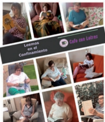
Alumnas de animación a la lectura.

Para conseguirlo ha sido muy importante la coordinación de todo el claustro de profesorado de Aulas de Educación de Personas Adultas adscritas al Centro Público de Fuentes de Ebro. Nos hemos reunido prácticamente todas las semanas (reuniones telemáticas, claro) y todo el mundo se volcó en que las actividades propuestas para todas las enseñanzas estuvieran semanalmente en la web del centro ( http://cpepafuentesdeebro.catedu.es/ ) a disposición del alumnado. Pero también ha habido una implicación