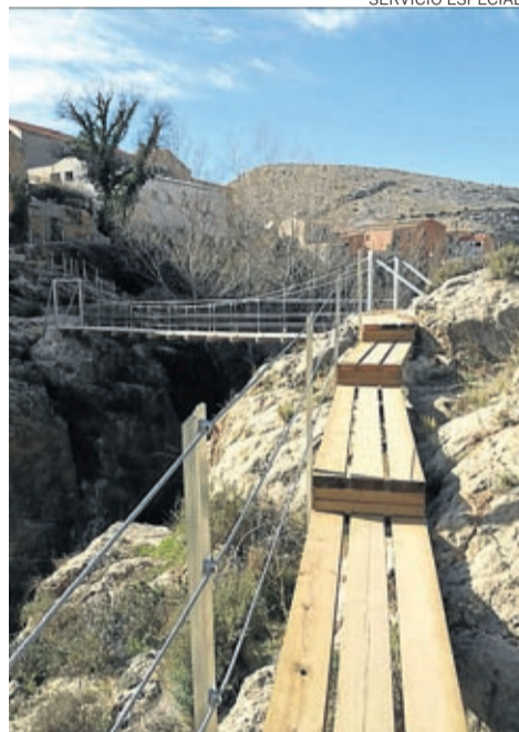
Almonacid espera retomar las visitas guiadas.