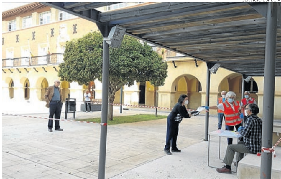
El consistorio adquirió y repartió mascarillas entre los vecinos empadronados.

«Esta línea de ayudas proviene de fondos propios, del remanente del Ayuntamiento de Belchite, porque queremos ayudar a quienes en es-