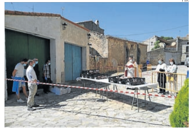
Los vecinos guardaron la distancia en todo momento.