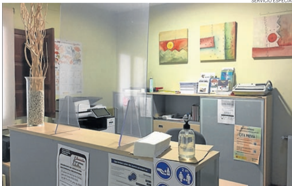
Se han colocado mamparas protectoras en los puestos de atención al público.

En esta desescalada la reapertura de equipamientos y servicios está siendo gradual y paulatina. La Comarca va recobrando su forma de trabajo habitual y presencial, aunque