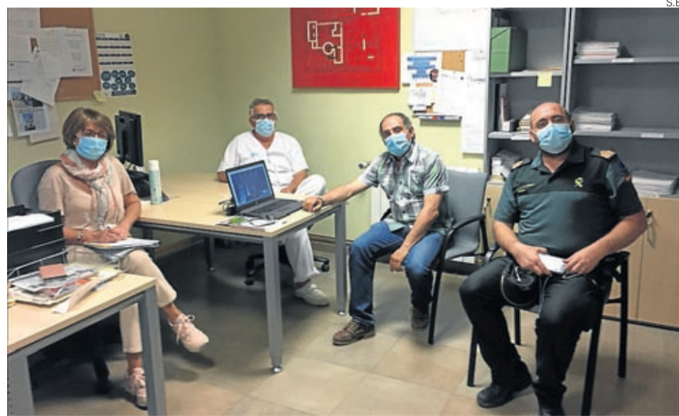
Los miembros de la Ucocal del Campo de Belchite se reúnen los martes en la sede comarcal.

Así, los objetivos de esta nueva unidad de cooperación son variados y pasan por la coordinación de recursos de ámbito comarcal; el planteamiento de necesidades y acciones a realizar; la organización de la logística y los abastecimientos; el traslado y transporte de mercancías y personas con di-