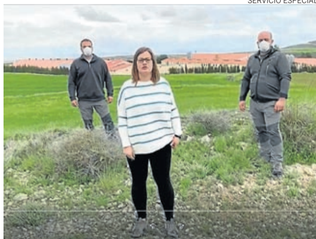
Los empresarios han realizado vídeos para acercar su situación.

Junto con la salud, que es el aspecto más preocupante, el efecto económico está siendo otro de los grandes problemas que está dejando la pandemia. El estado de alarma supuso una paralización de todas las empresas, excepto aquellas de primera necesidad y, desde Adecobel, Grupo de Acción Local de la comarca Campo de Belchite, que gestiona las ayudas Leader para