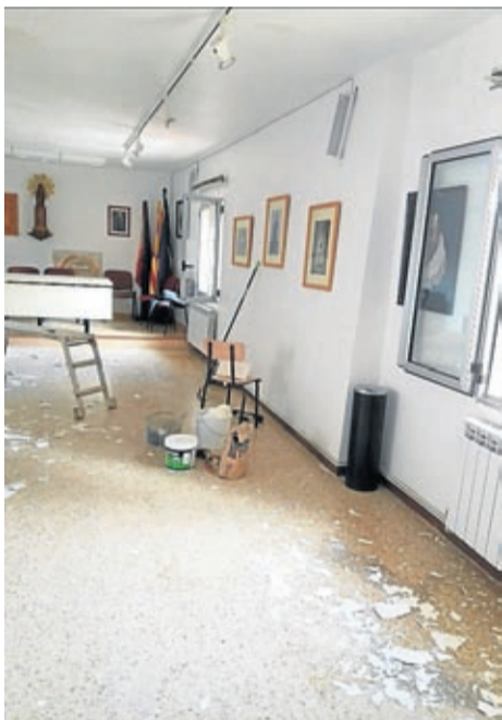
Las lluvias provocaron daños en el consistorio.

Espera recibir las obras de la pista de pádel y retomar las visitas turísticas y baraja la apertura del gimnasio y piscina