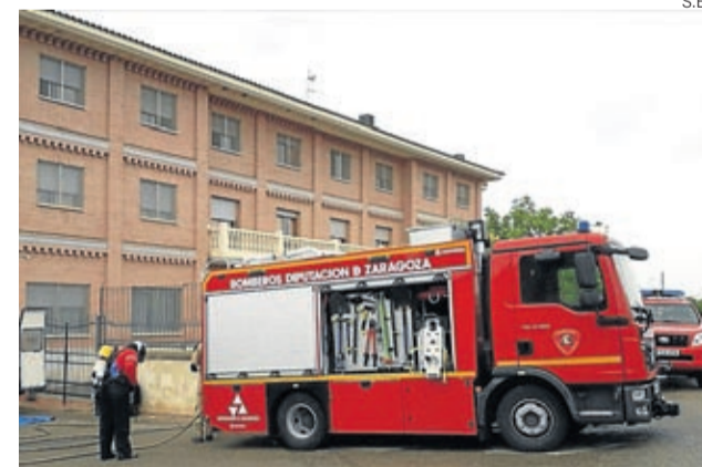
Bomberos de la DPZ colaboraron en desinfectar residencias.

del Ejército estuvieron presentes en los municipios para cubrir las necesidades de los pueblos durante el estado de alarma, con misiones que consistieron en la desinfección de las residencias de Letux y Lépera, donde también intervinieron y colaboraron los Bomberos de la Diputación Provincial de Zaragoza.