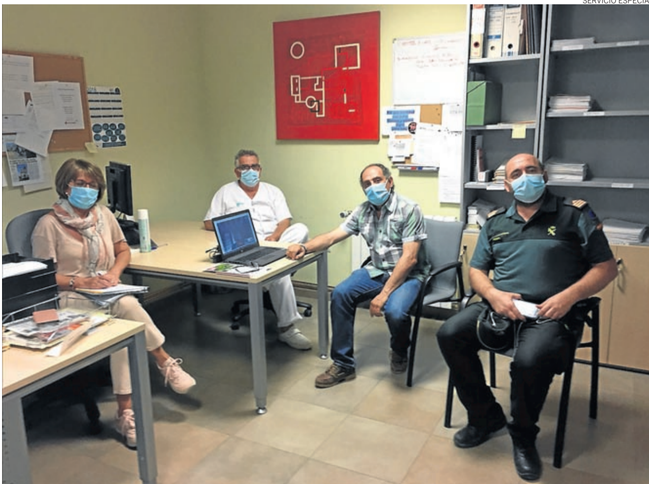
La comarca ha constituido su Unidad de Coordinación Operativa Comarcal que se reúne todas las semanas.