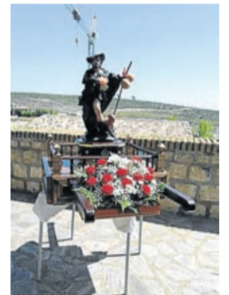
El santo salió para la bendición.

A pesar de que la romería no se llevó a cabo, los vecinos pudieron sacar al santo para que se realizara la ben-