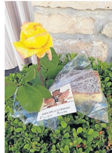
Detalle del Día de la Madre en Lécera.