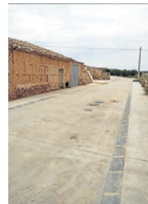
Nuevo aspecto de la calle Mayor.