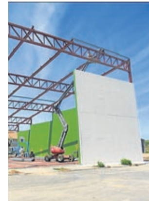
El frontón se está cubriendo.

Y también durante estas semanas Almochuel ha continuado con las obras pendientes y, a pesar de aún no saber qué podrán hacer con las piscinas, se ha llevado a cabo una remodelación que está prevista que acabe dentro de un mes, justo cuando de normal suelen abrir las puertas cara al público. Estas obras, a las que se han destinado 33.000 euros financiados por el Plan PLUS 2020 de la Diputación Provincial de Zaragoza, se reali-