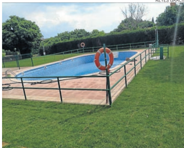
Se ha renovado el césped y riego de las piscinas

Y, para mantener el ánimo alto, todas las tarde, a las 20.00 horas ha sonado a través de la megafonía local una canción diferente para mostrar también el agradecimiento a todos aquellos que han hecho lo posible para hacer más llevadera la situación. Unas semanas en las que el contacto social casi desapareció por completo y en las que Plenas grabó dos videos para