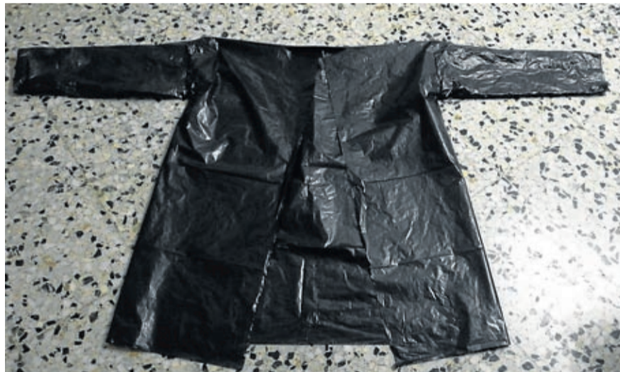
Las belchitanas hicieron cientos de batas como esta.