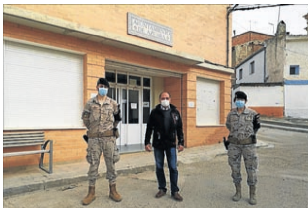
El Ejército ha estado presente en muchos municipios.

administraciones aragonesas frente al coronavirus. Estos encuentros también han servido para tratar los asuntos extraordinarios de seguridad y salud de la población, realizando un seguimiento de cada territorio y de sus necesidades específicas, así como la aplicación de la normativa sanitaria estatal, destacando las publicaciones especiales durante todo el estado de alarma hasta la actualidad para coordinar las actuaciones en materia de protección civil.