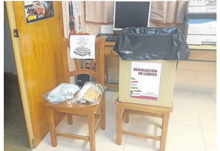
Es necesario el uso de mascarilla y gel desinfectante en la biblioteca.