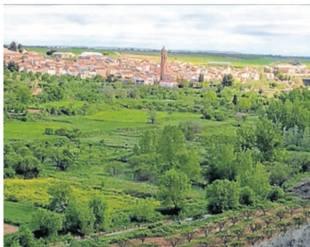
Los vecinos disfrutaron en sus paseos de los verdes paisajes.

Un concejal se ha encargado de desinfectar las calles con su tractor