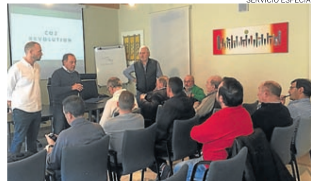
El proyecto se expuso a los alcaldes de los municipios.

Las reforestaciones podrán realizarse en montes municipales y también en parcelas particulares, sin gastos para las administraciones locales. Se trata de un pro-