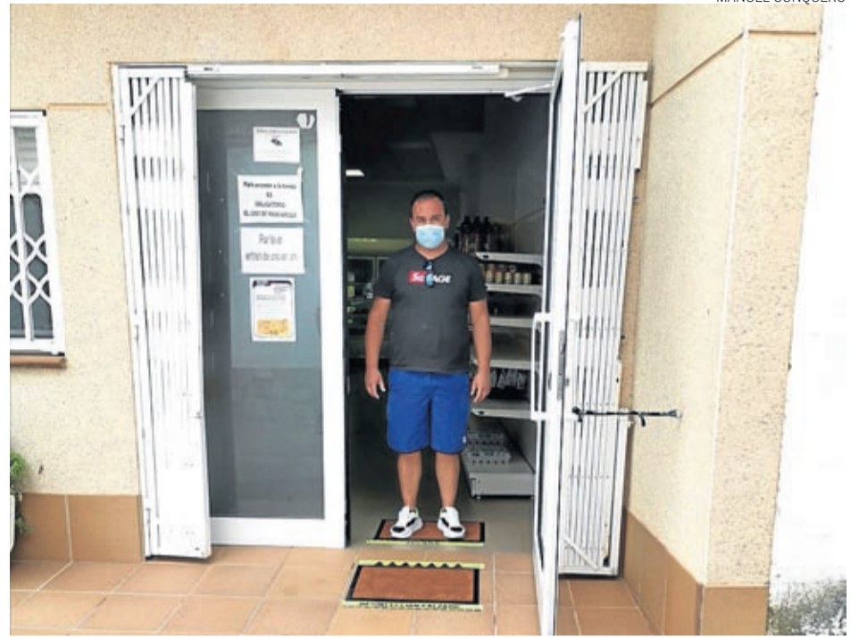
El ayuntamiento ha colocado alfombrillas para desinfectar los pies en la entrada a la tienda.

También es intención del Ayuntamiento de Almonacid de la Cuba abrir el nuevo punto de información turística de la localidad ubicado en el antiguo molino el próximo 1 de julio, retomando así las visitas guiadas y por las pasarelas de la presa romana. Unas visitas que se podrán contratar tanto en la propia oficina como en la página web de Turismo de Almonacid de la Cuba, y que empezarán solo los fines de semana con la idea de poder ampliarlas entre semana conforme vaya pasando el tiempo. ■