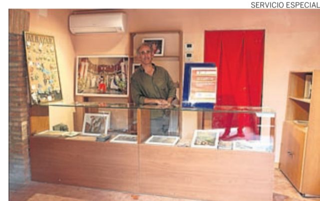
El antiguo molino de Almonacid acoge la oficina de turismo.

Otro de los expedientes que han recibido ayuda en este 2020 ha sido el Ayuntamiento