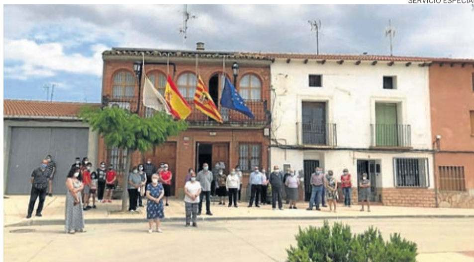
Vecinos y autoridades guardaron un minuto de silencio por las víctimas del coronavirus.

Un tema que preocupaba a los vecinos de Letux eran los huertos. Por este motivo, el ayuntamiento también facilitó la compra de plantas para poder hacer un pedido en cuanto se levantara la restricción de acceso a los huertos.