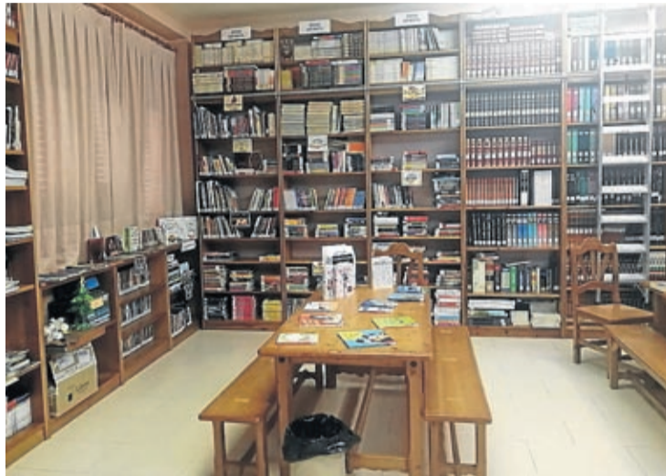
La biblioteca funciona solo para los servicios de préstamo y devolución.